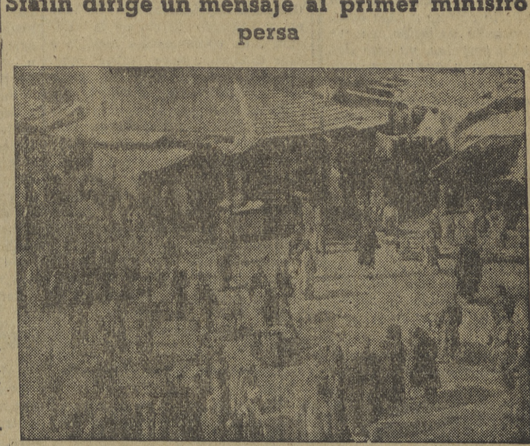
EN UN MERCADO PERSA

Tropas británicas custodian los campos petrolíferos de Kirkuk Aunque el problema se arregle, los rusos no se retirarán Stalin dirige un mensaje al primer ministro persa