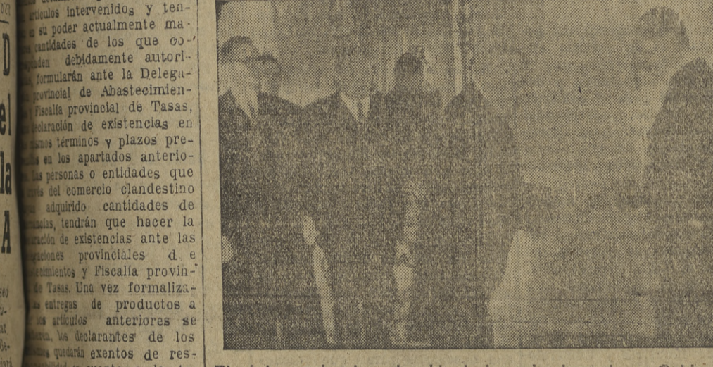
El viejo mariscal se despide de los miembros de su Gobierno y estrecha la mano de su sucesor Paasikivi. A la izquierda se ve a los ministros Mauno Pekkala, T. Orngreny y Westerinen.

EL PASO DEL PUEBLO. En la foto superior, el viejo mariscal Paasikivi se despide de los miembros de su Gobierno y estrecha la mano de su sucesor Paasikivi. A la izquierda se ve a los ministros Mauno Pekkala, T. Orngreny y Westerinen.