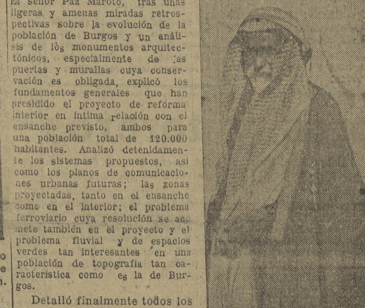
Un viejo guerrero kurdo.