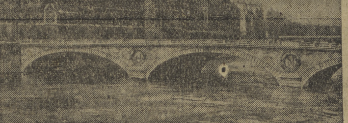
El monumental edificio del Palacio de Justicia de Francia, a orilla del Sena, donde se está celebrando actualmente el proceso contra el doctor Petiot.