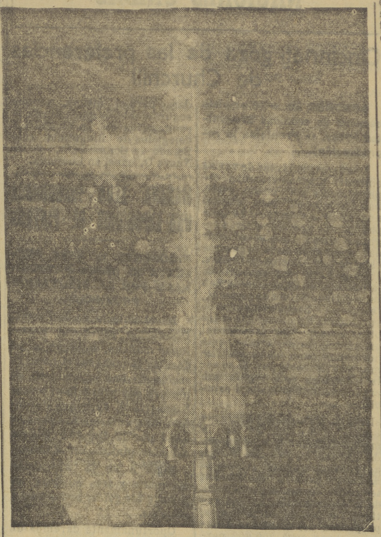
Cruz gótica renaciente labrada en piedra.