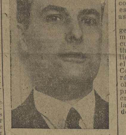
Don Blas Pérez, ministro de la Gobernación

Inauguración de grandes obras en Guernica y Munguía