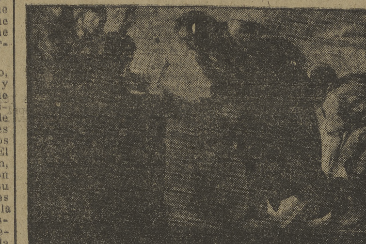
San José, Patrono del Seminario Menor de la Diócesis de Burgos