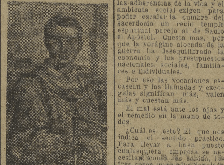
San Agustín, el doctor de la Iglesia bajo cuya orientación teológica los seminarios alcanzaron su mayor auge

¡Católicos! Conviene una vez más que los fieles busquen por las cosas de la humanidad, son a Dios, habese alejado de Dios, damos y ayudemos a dar nuevos santos y que nos acerquen a Él. Clementina Platón de