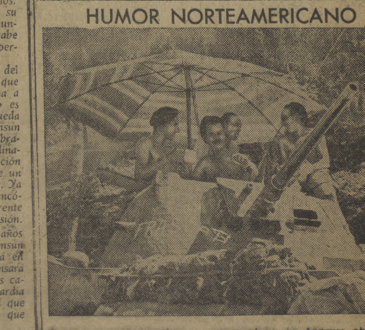
Soldados norteamericanos aprovechan un tanque abandonado para hacerse una fotografía humorística en los primeros días de verano, que ahora comienza en el hemisferio austral.

HUMOR NORTEAMERICANO Soldados norteamericanos aprovechan un tanque abandonado para hacerse una fotografía humorística en los primeros días de verano, que ahora comienza en el hemisferio austral.