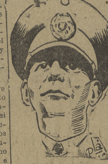
EL GENERAL FARRELL que se encuentra en una difícil situación a causa de la actitud de los estudiantes argentinos.