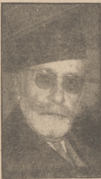
En relación con los disturbios tuneecinos, a d q u i ere primacia informativa esta foto del Bey de Túnez, quien, en su espléndido Cadillac, sale de su palacio en Haman Lif, cerca de Túnez. (Foto A. P.)

NUEVA YORK, 5.—El "New York Times" publica un editorial, en el que condena la decisión de los países del bloque árabe-asiático de llevar la cuestión de Túnez al Consejo de Seguridad de la O. N. U. "La intransigencia por ambas partes—dice—y la intromisión excesiva desde fuera, es el mejor camino para preparar una tragedia para todos los interesados. Añade que hay motivos fundados para criticar a los franceses por su política, pero que no se puede admitir que los tuneecinos pidan una independencia total para fecha inmediata. (Efe.)