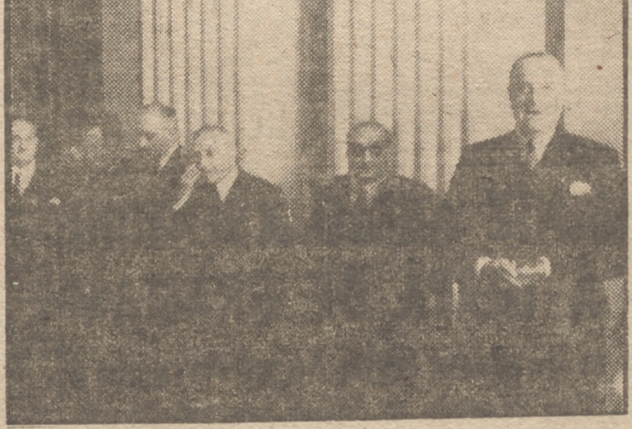
El nuevo director general de Puertos, señor Pérez Conesa, ha tomado posesión de su cargo, presidiendo el acto el ministro de Obras Públicas, conde de Vallellano.

Presidió el acto el ministro de Obras Públicas