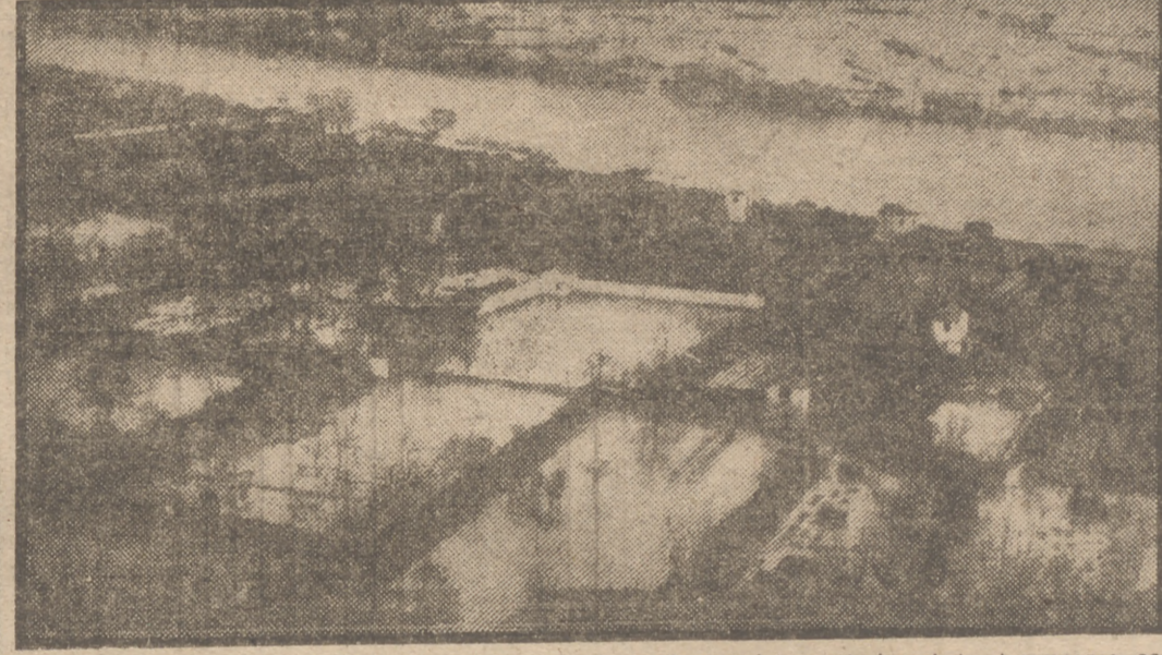
Una vista de la huerta de Tudela, llamada la "Mejana", completamente inundada al romperse los diques de contención del río Ebro, cuyas aguas alcanzaron un nivel de 6,28 metros sobre el normal.

ZARAGOZA, 5.—El río Ebro continúa con su imponente crecida, que a su paso por Zaragoza llega hasta tres metros por encima del nivel ordinario, pero con tendencia a decrecer, según los datos facilitados por la Confederación Hidrográfica.