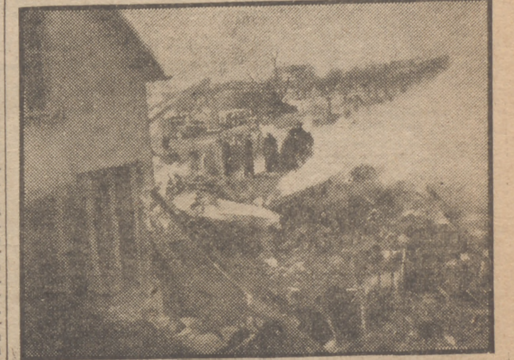
Un transporte aéreo americano se estrelló recientemente contra un poblado cercano al aeropuerto de Francfort. La tripulación se salvó en paracaídas. En la foto, a la derecha, los restos aún humeantes del avión siniestrado.