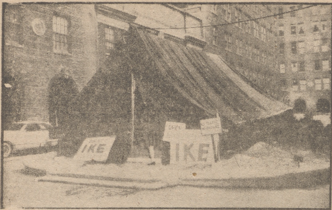
Los partidarios de la candidatura del general Eisenhower para la Presidencia de los Estados Unidos montan su cuartel general en una tienda de campaña a la entrada del hotel Marguerite, en Nueva York.