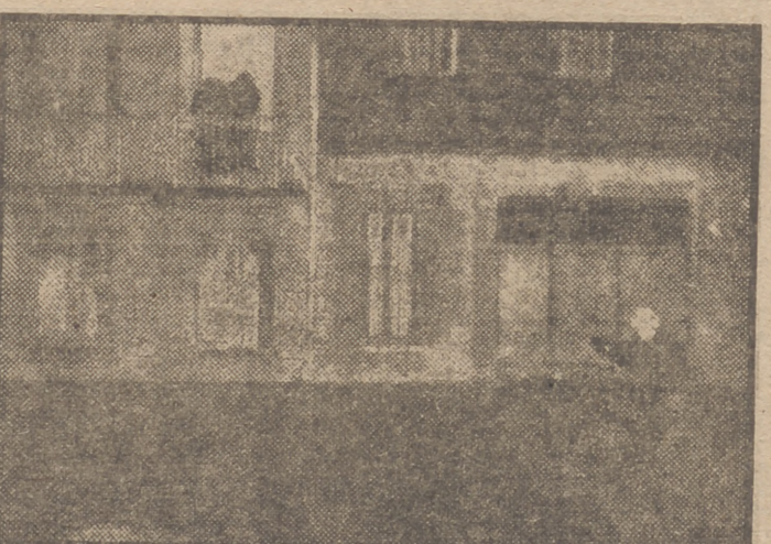
Las crecidas de los ríos del sur de Francia han provocado grandes inundaciones en Toulouse, Montauban, Tarbes y Narbona. He aquí una vista de los barrios de Toulouse, a orillas del Garona, donde se impuso la evacuación de los habitantes.