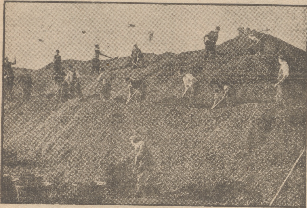
La foto muestra un momento del aplido de aceituna para su mejor recogida y traslado al molino en una fábrica de Almendralejo, en la provincia de Badajoz.

HAY QUE CUIDAR MEJOR LA ELABORACION DEL ACEITE