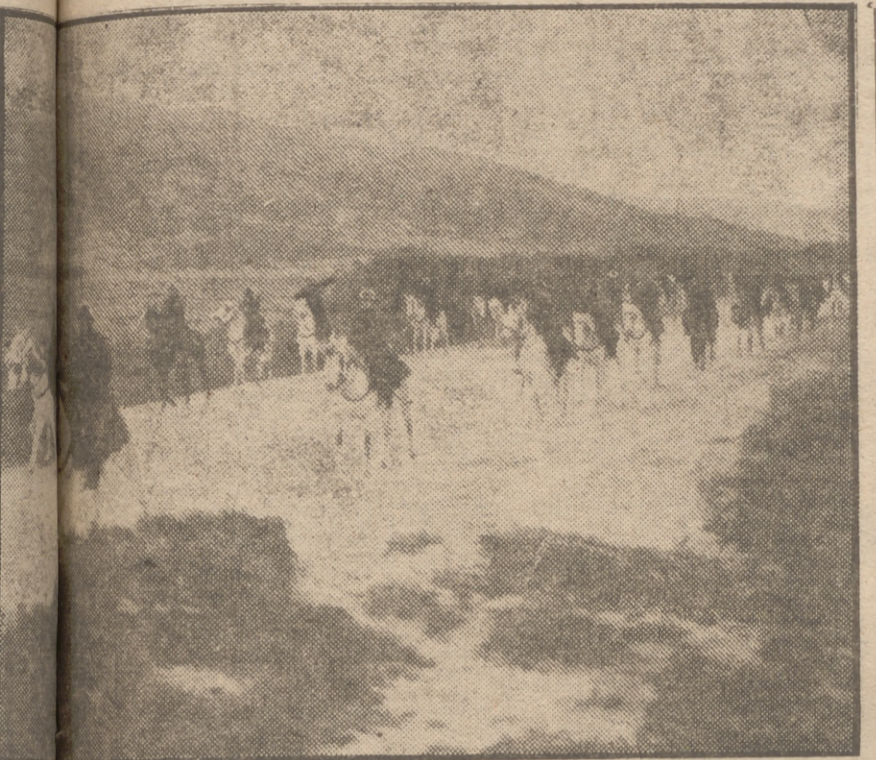
Una unidad recién llegada a Túnez con el fin de participar en el restablecimiento del orden tunecino avanza por una carretera en el curso de su misión.

Los extremistas han reanudado los desórdenes súbitamente para hoy o mañana la repuesta del Bey a la nota francesa DE SABOTAJE EN TODO EL PROTECTORADO