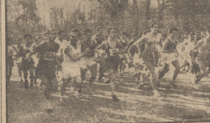
La foto recoge el momento de la salida de los participantes en la prueba de pedestristimo disputada el domingo bajo el título Trofeo "El Alcázar", y que constituyó un gran éxito