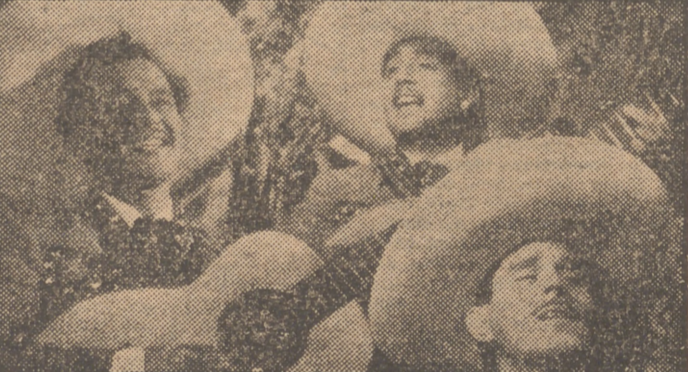
Reproducimos una escena de la película musical de gran éxito "Me he de comer esa tuna", en la que canta sus mejores canciones el popular Jorge Negrete. El lunes próximo será presentado este film, por Distribuidora Chamartin, en el cine Imperial.