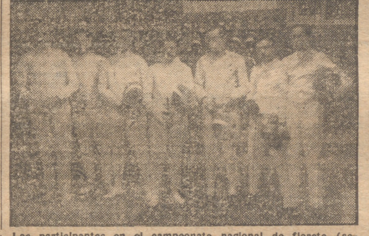
Los participantes en el campeonato nacional de florete (segunda categoría), prueba con la que dió comienzo el campeonato de España de esgrima.