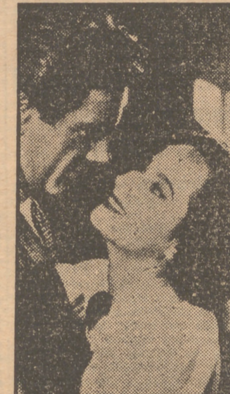
Merle Oberon y Charles Korvin, pareja central de "Como te quise te quiero", uno de los films que ha causado verdadera sensación en Norteamérica por la fuerza de su argumento y su sentido humano. Fue elogiadísimo por la crítica neoyorquina. Para fecha próxima, Astoria anuncia la presentación en la pantalla madrileña de esta producción excepcional.