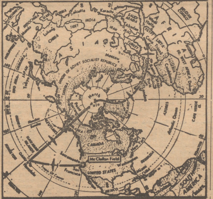
Este mapa de las regiones polares indica la ruta seguida por una superfortaleza volante del Ejército norteamericano en su vuelo desde Honolulu al Cairo, pasando por encima del Polo Norte.

Por su parte, los comandantes de la zona de Alaska dicen saber del itinerario que siguen los barcos soviéticos en el Pacífico del Norte, pues el Gobierno de Moscú notifica a Washington cuando aquellos parten de Siberia.