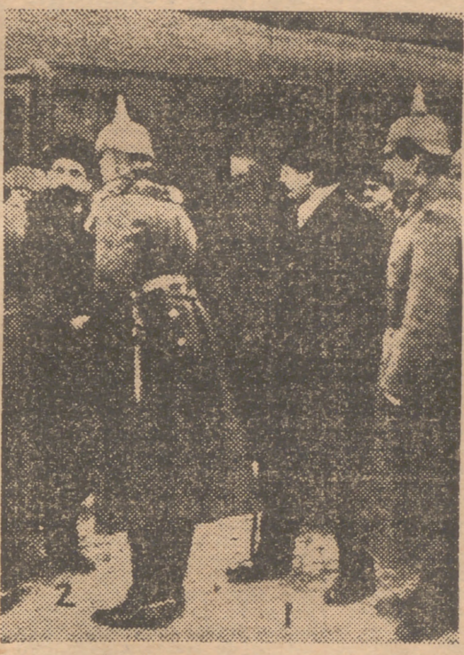
El lunes día 11 se celebra el aniversario del armisticio de 1918. Esta fotografía retrospectiva recoge el momento de la llegada de los delegados.

Dos fiestas seguidas pueden ser una tentación para los abstencionistas. El puente, el famoso puente del sábado al martes... Porque el lunes, aniversario del armisticio de 1918, es también festivo, aunque por gracia especial se publiquen los periódicos. Saldrán los de París y provincias con las páginas cuajadas de resultados electorales, retratos de candidatos triunfantes y algún que otro comentario vituperador o arrogante. Retengamos las cifras de la última consulta electoral, el referéndum. De 26.203.459 inscritos sólo votaron 17.407.307, pronunciándose por la Constitución 8.263.416, y en contra, 8.143.891. ¿Tendrá la abstención la misma importancia para elegir 619 diputados, o sea 32, más de la fenecida Asamblea Constituyente? En este caso sería una Re-Constituyente de poca eficacia curativa.