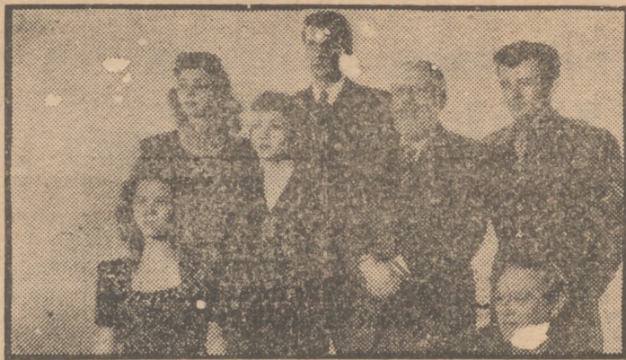
He aquí al magnífico elenco de artistas protagonistas de la verdadera superproducción "Desde que te fuiste", que el lunes próximo presentará Procines en el cine Avenida. Componen el reparto de este magnífico film Claudette Colbert, Jennifer Jones, Shirley Temple, Joseph Cotten, Lionel Barrymore, Robert Walker y Monte Woolley.