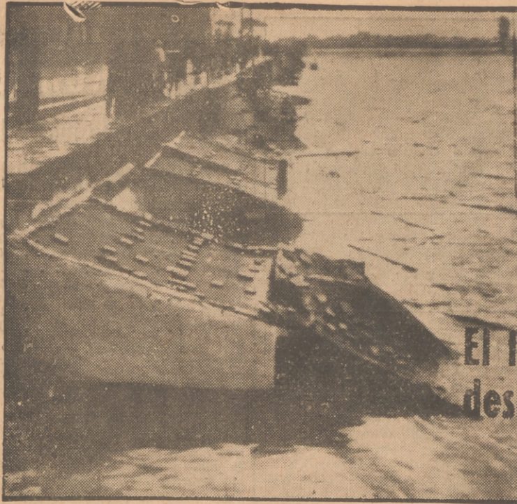
El trágico desbordamiento del Turia

Estas casuchas habitadas por indigentes fueron inundadas por completo, y muchas de ellas derrumbadas por la furia de la corriente.