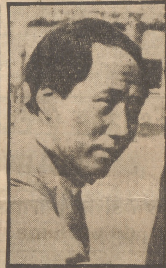
Mao Tsé Tung, dictador rojo de China

El reconocimiento de los nuevos gobernantes comunistas de China por la Unión Soviética plantea otro problema en el momento en que Vichinsky propone en Nueva York una entrevista de los "cinco grandes" (notese que se habla de los "cinco", y ya no de los "cuatro"). Es que Vichinsky conoce exactamente la fecha del reconocimiento de Mao Tsé Tung, fijado antes de su salida de Moscú. Si ahora esos "grandes" se reúnen, ¿cuál será el quinto "grande"? La China nacionalista, lamentablemente arrollada, o el Poder comunista, reconocido desde el domingo por la Unión Soviética? Una vez más, los funcionarios de la Secretaría de Estado se han cogido los dedos al anunciar Acheson, después de la publicación del último Libro Blanco, que el Gobierno rojo chino sería reconocido "después de la conquista de Cantón y cuando