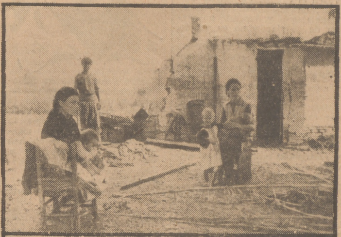
Las pequeñas casas ocupadas por familias modestas quedaron derruidas por la fuerza de las aguas. Aquí, unos humildes huertanos de Monteolivete que han perdido cuanto tenían: su pobre hogar, su reducida cosecha...