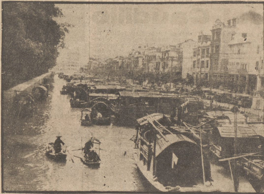
Cantón, próximo objetivo de los comunistas chinos

Al reconocer a Mao Tsé Tung, Moscú hace pesar una grave amenaza sobre la O. N. U.