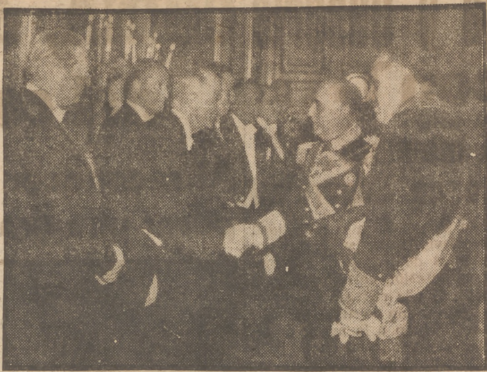
El Jefe del Estado, Generalísimo Franco, recibe las felicitaciones del Cuerpo diplomático acreditado en Madrid durante la brillante recepción celebrada en el Palacio de Oriente con motivo de la conmemoración de la exaltación de Franco a la Jefatura del Estado

En los Estados Unidos son mayoría los que opinan que deben restablecerse las relaciones comerciales con España, y bien claramente quedó expuesto el sentimiento del Senado norteamericano con respecto a la concesión de un crédito. Si ahora se reprodujera la proposición, indudablemente que prosperaría. Es ilógico y absurdo que los Estados Unidos den dinero a países que viven en el mismo sector geográfico que España y a España, no. España necesita a los Estados Unidos y los Estados Unidos precisan de España. Tanto desde el punto de vista militar como desde el económico, España es un factor vital.