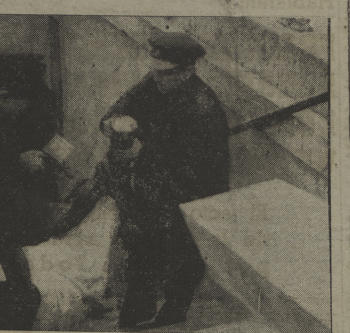
Durante estos últimos días, la artillería fascista de largo alcance bombardea Madrid sin objetivo alguno. Los obuses enemigos caen en las calles y causan bajas en la población civil. He aquí el momento de sacar el cadáver de una pobre mujer, cuya vida ha sagrado la barbarie fascista.