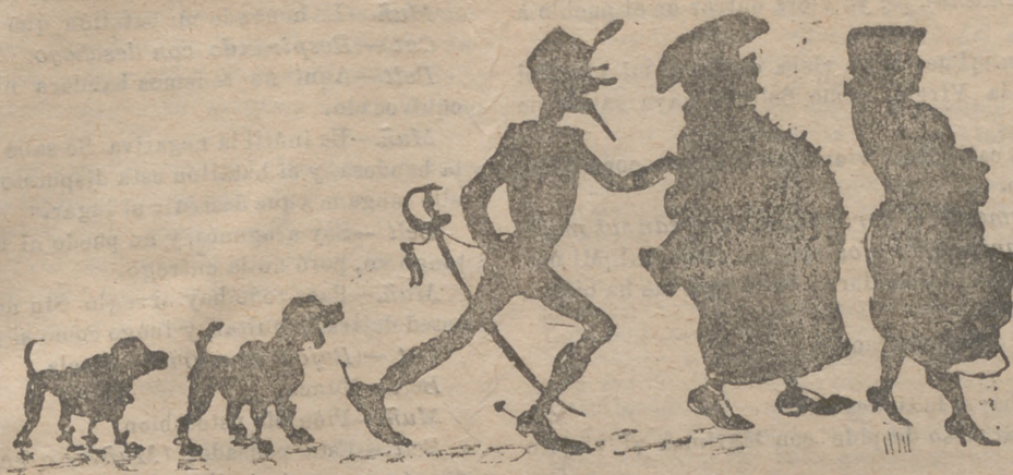
LA ESCALA DEL AMOR