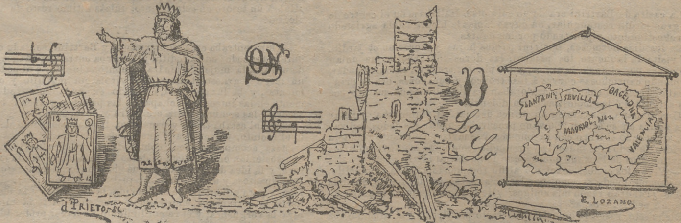
(LA SOLUCIÓN EN EL NÚMERO PRÓXIMO)

En ella se pide que dichos arquitectos no puedan durar en su puesto más de cuatro años, ocupando sus plazas por medio de oposi- ción rigurosa.