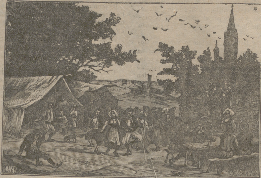
UNA BODA EN BRETAÑA