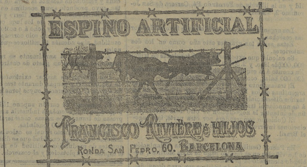
ESPINO ARTIFICIAL FRANCISCO RIVERO Y HIJOS RONDA SAN PEDRO, 60. BARCELONA

PANADES, Hermanos Aparato de rectificación.