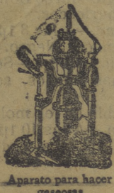
Aparato para hacer gaseosas