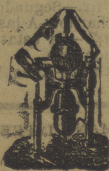
Aparato para hacer gaseosas