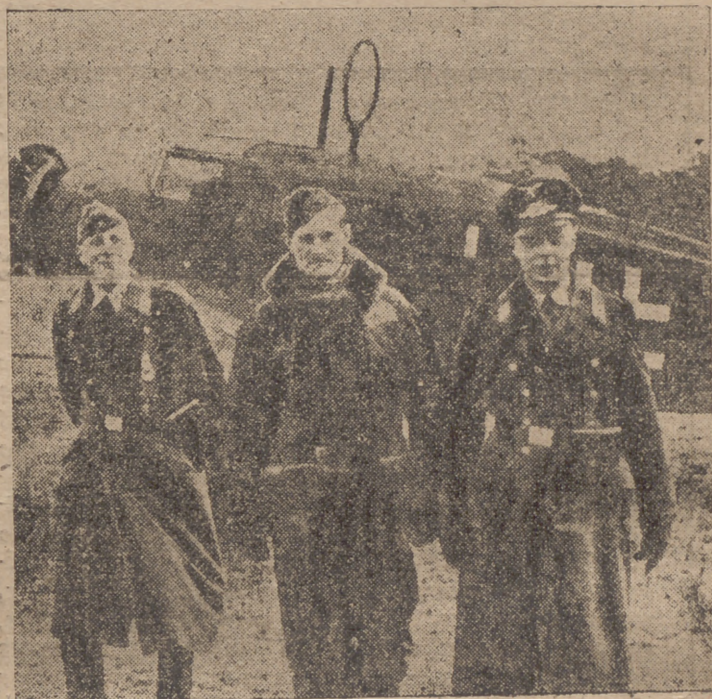
El primer piloto británico hecho prisionero por los alemanes; fué derribado con su avión en el importante combate aéreo que tuvo lugar el 18 de Diciembre próximo pasado.