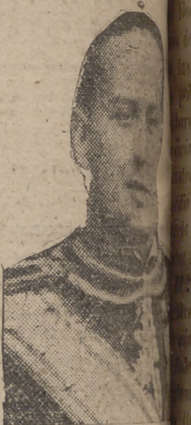
LA COLABORACION ALEMANA

No hay que olvidar, siguiendo diciendo el conde Ciano, que los que se opusieron a Italia por la acción de Etiopía, que no pudieron anular lo que constituía un acontecimiento formidable para la Historia, se engañaban ellos mismos al esforzarse en no querer reconocer el Imperio de Roma.