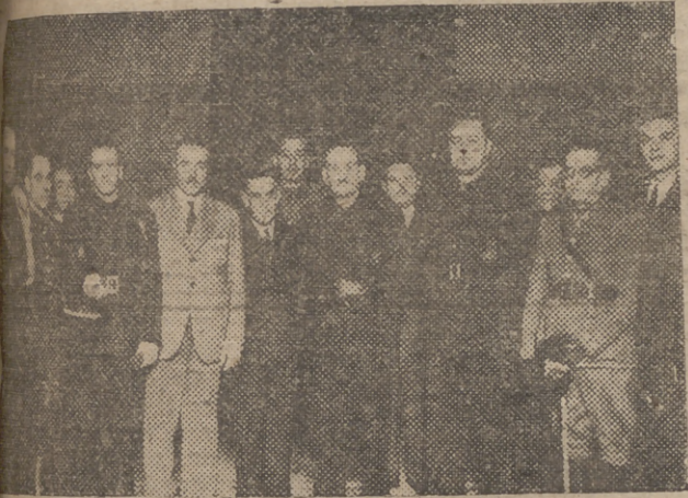
El nuevo Gobernador Civil, camarada José Luis Arrese, después de posesionarse de su cargo, acompañado del Gobernador saliente, camarada Prieto Moreno, alto personal del Gobierno Civil y representantes de la Prensa local. (Información en la página 2)