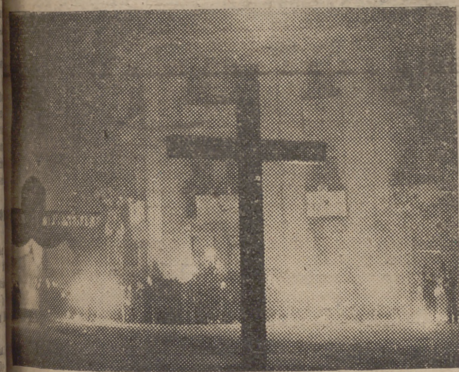
Llegada a Albacete de la comitiva fúnebre.

El traslado de los restos de José Antonio