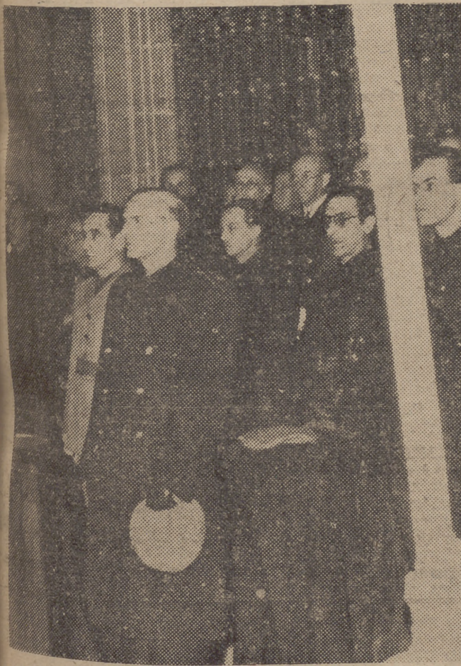
ALICANTE.—La Junta Política de F. E. T. y de las Jons, rezando el rosario en la Capilla ardiente de José Antonio en la Iglesia de San Nicolás.