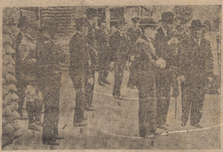
Primera fotografía hecha pública en el Continente de la reunión que días pasados celebró, en Inglaterra, el Consejo Supremo franco-británico. Puede verse, de derecha a izquierda, a los Sres. Daladier (1), Corbin (2), Embajador de Francia en Londres; Doutry (3), Ministro de Armamentos; Chamberlain (4), Lord Halifax (5), Lord Chatfield (6), Almirante Darlan (7) y al general Gamelin (8) al salir del hotel donde se celebró la citada conferencia.