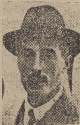
Neville Henderson, Embajador inglés en Berlín, que ha regresado a Alemania con la respuesta del Gobierno británico al mensaje de Hitler