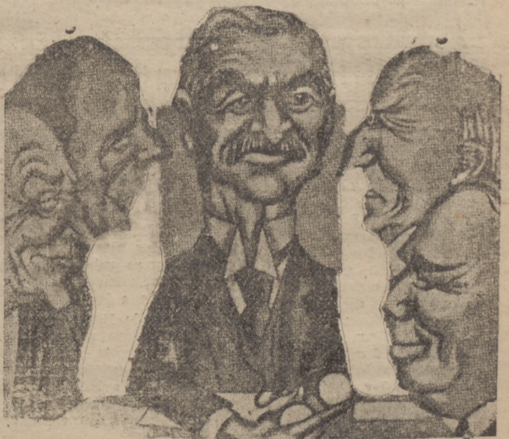
De izquierda a derecha, Simon, Halifax, Chamberlain, Stanhope y Belisha, las cinco figuras más relevantes del Gobierno inglés y a quienes incumbe el delicado cometido de definir la actitud de Gran Bretaña en esta hora decisiva para la paz.