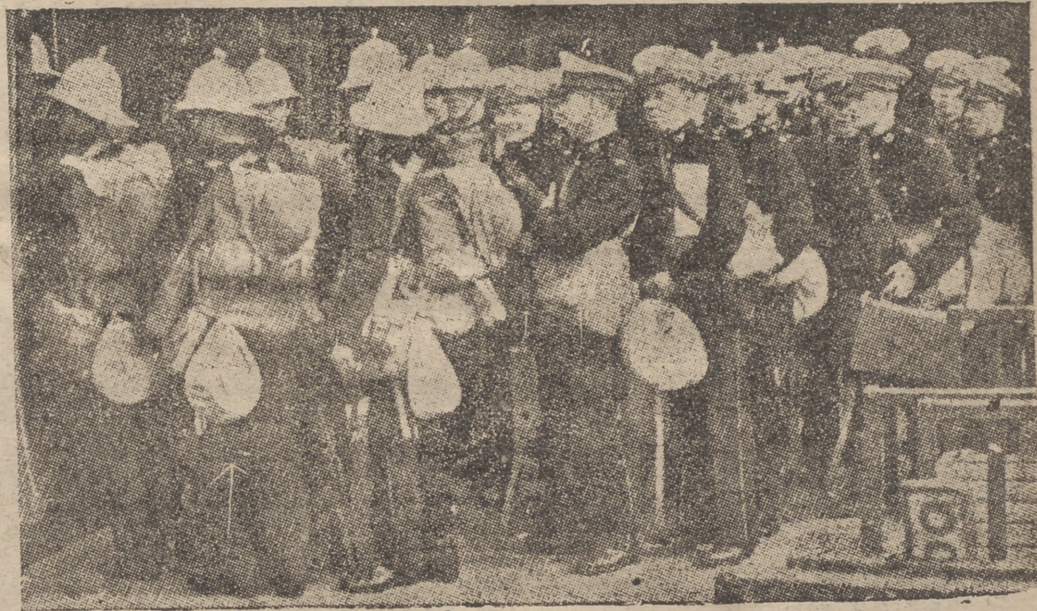
Los movilizados de la Marina inglesa salen para sus destinos. En todas las estaciones de Londres el intenso movimiento militar denuncia la gravedad de esta hora.