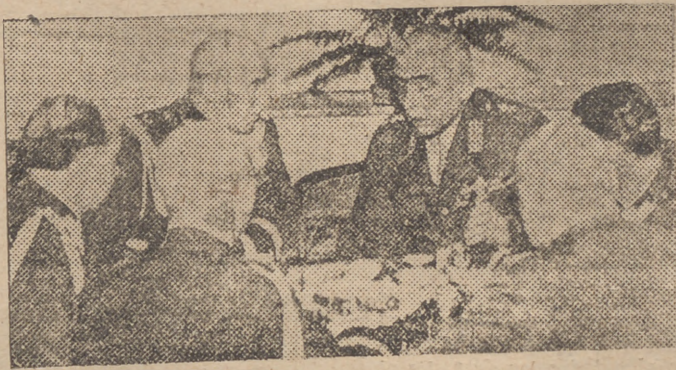
En esta fotografía, obtenida en Varsovia aparecen el inspector general de los ejércitos de mar y tierra británicos, Edmundo Ironside; el mariscal polaco Smigly; el ministro polaco de la Guerra, general Kasprzski; el general Noewid Neugebauer; el general Litwinowicz y el general Stachewicz durante una reunión celebrada recientemente en la capital polaca