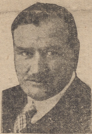
M. Daladier, que ayer obtuvo la ratificación de confianza en la Cámara francesa