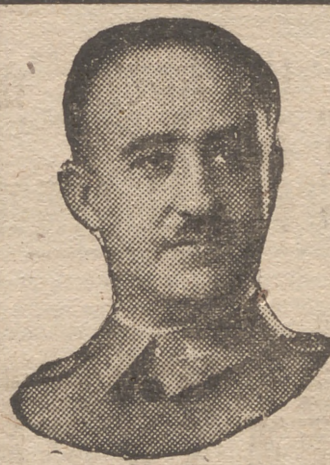
En el suyo, si armara al pueblo...

STAMBUL, 12.—Se han producido algunos cambios en el Gobierno. El ministro del Exterior ha sido designado ministro de Justicia. Para el Ministerio del Interior ha sido designado un íntimo amigo del Presidente. Para la cartera de Justicia ha sido nombrado el señor Houral.