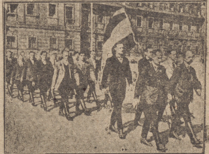
Una unidad de las fuerzas voluntarias sudetes, formadas por iniciativa de Huxlin, realizando ejercicios de instrucción militar

A las diez y cuarto de esta noche y como segundo aniversario de la liberación del Alcázar de Toledo, se celebrará en los estudios de Radio nacional un acto de afirmación hispano-lusitana, que será retransmitido por todas las emisoras nacionales y portuguesas.