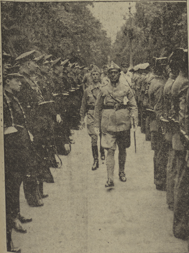
El Gobernador Militar pasa revista a las fuerzas de Asalto.