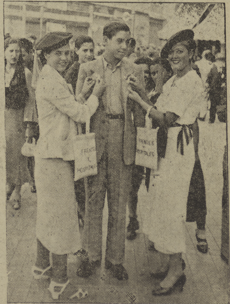
Dos bellísimas margaritas imponiendo la flor de su nombre.