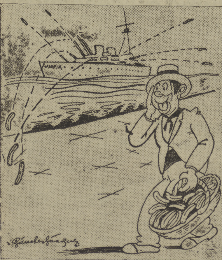
¡Plátanos del Canarias!

EL PREGON DE MODA EN LA ZONA ROJA Por SANCHEZ VAZQUEZ.