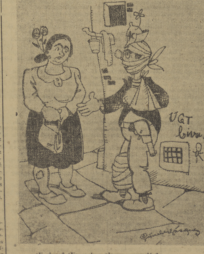
—¿Y ahora? ¿Vas a ir a alguna operación? —Sí; de apéndice.