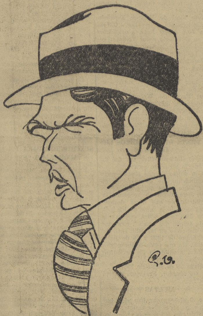
FIGURA DEL DIA

Cuando aparezca este apunte de M. Eden, ya estará nombrado el nuevo Ministerio inglés.