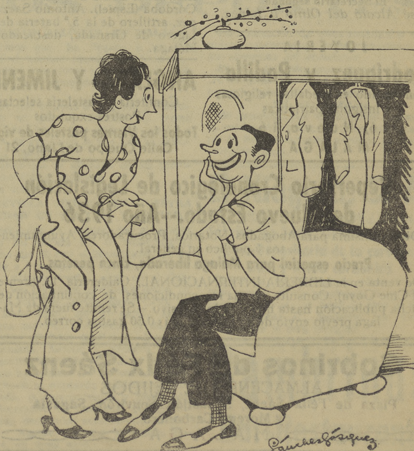
...Como llueve, y hace frío, te he sacado un ruso. ...¡Un ruso!... ¡A los «rusos» no quiero yo ni verlos!