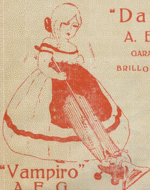
"Vampiro" A. E. G.