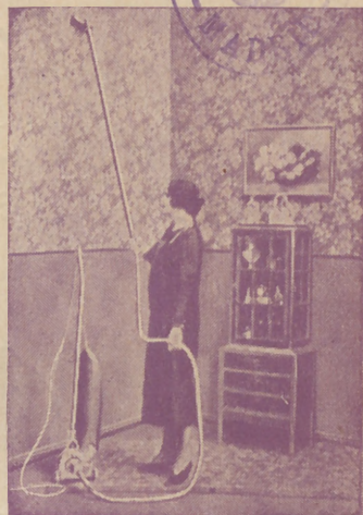
"Dandy" A. E. G. GARANTIZA BRILLO ESPEJO