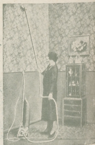
“Dandy” A. E. G. GARANTIZA BRILLO ESPEJO.