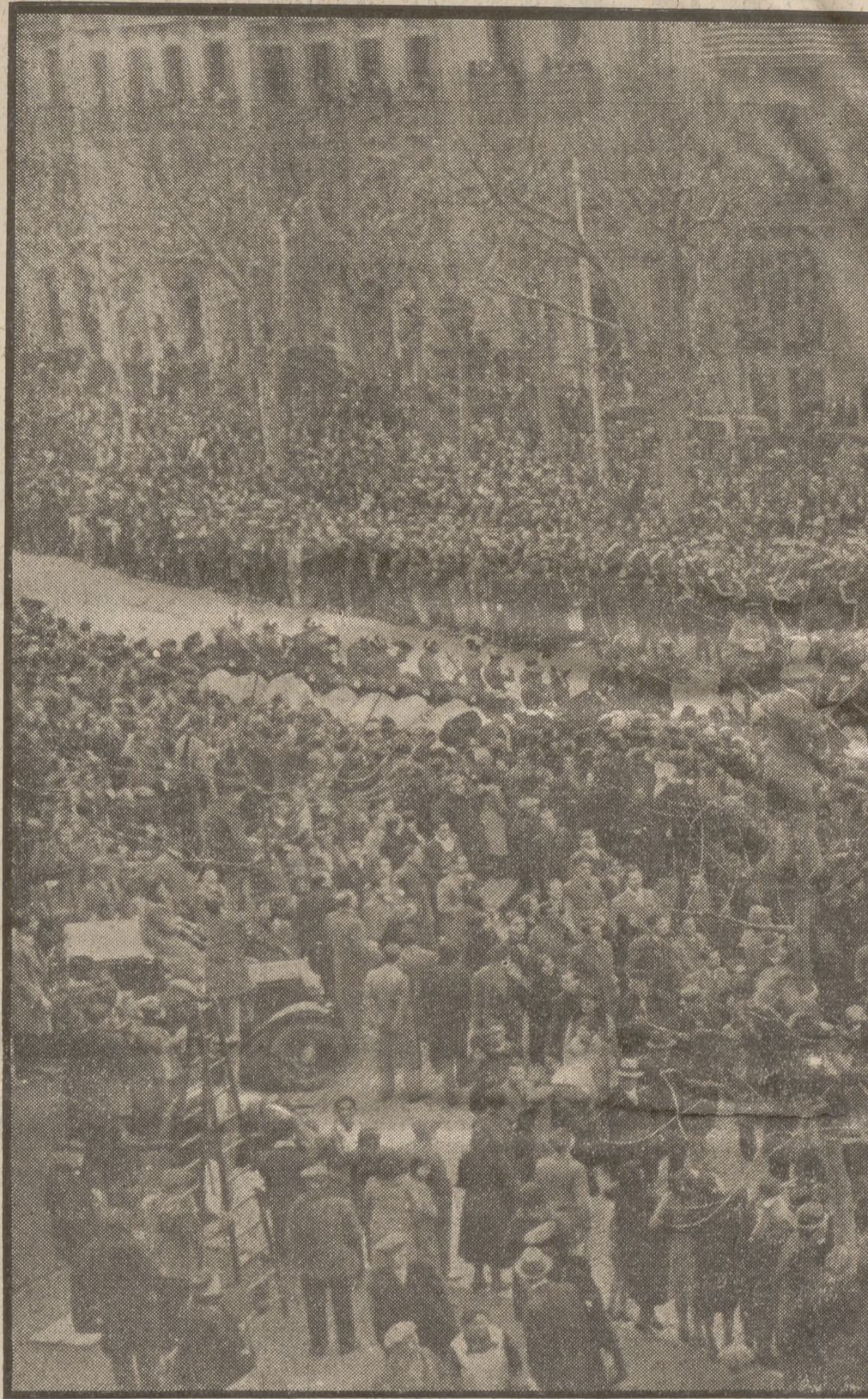
El poble de Catalunya —mai com ara la paraula «poble» no havia tingut un altre el patrici insigne que per ell va sofrir, que per la seva culpa va lluitar, que va ofèndre i aquest agràdament sincer va palesar-lo en l'acte corprenedor d'ésser conduïdes a l'acte. Tot Barcelona, moguda per un sentiment emotiu, es llençà al carrer. De tot Catalunya l'inacabable seguici —manifestació única en la història dels pobles— o bé presenciava sap guardar al seu cor, com a flama viva, el record d'aquella

ra Gass... l'Urugu... ca. El s... d'on fou... gué con... I. Palad... defensa... L'any 19... gica, des... tantmen... migrats... treballav... de la di... monarqu... gener de... va caure... per Ber... talunya... polítics... excepció... tia: Ma... guer no... saven a... saven b... talunya... amb el... Macià... com ho... nic exili... talunya... En to