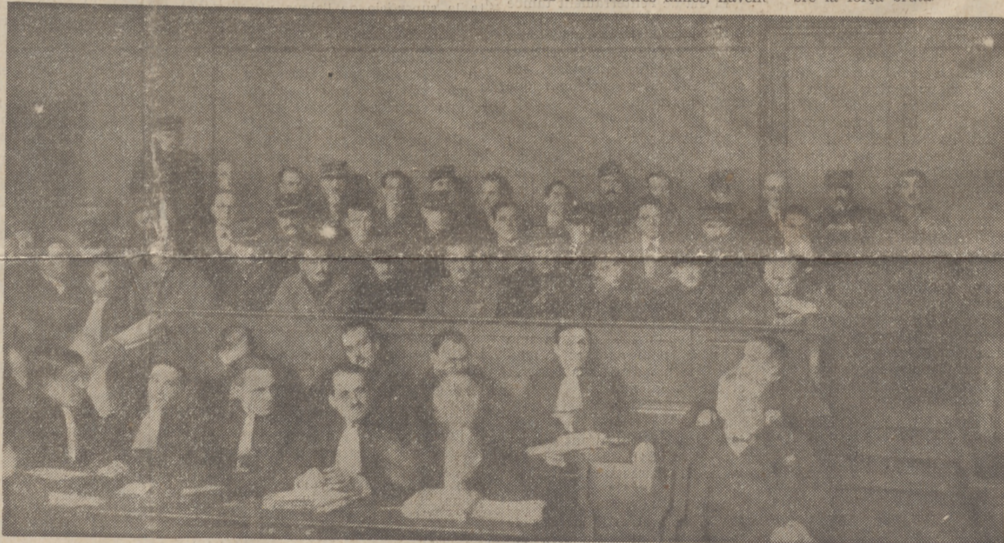
Una fotografia històrica és aquesta dels encausats pel moviment patriòtic de Prats de Molló esperant el veredict de la justícia francesa. En el primer rengle, ocupant el primer lloc, Francesc Macià, el gran patriota, escolta les brillants al·legacions de la defensa i els respectuosos parlaments dels acusadors. L'insigne advocat francès Henry Torres, convertit a la causa catalana per la gesta heroica del nostre cabdill, va exposar al món la raó del nostre plet, la justícia de les reivindicacions de Catalunya. I el món, fins aleshores indiferent, va onèixer on anava i què volia la nostra terra, oprimida durant segles i segles per les castes que sostenien els indesitjables Borbons. Francesc Macià i els seus companys d'aventura obriren al món, de bat, les portes del pensament de Catalunya. Sense aquella «bogeria» —com la qualificaren els curs d'esperit— Catalunya no fóra avui on és. El camí de la justícia li estaria barrat encara...

No hi ha, en aquest país un ciutadà francès que no es senti solidari de les reivindicacions del coronel Macià i dels seus amics d'aquestes reivindicacions cavalleresques, que, en la noblesa de la seva causa justa, representen, encarnen, expressen en triomf del treball sobre l'exploació, de l'esperit sobre la matèria, la victòria de la llibertat sobre l'arbitrarietat, i, a la fi, la revenja de l'home sobre la força bruta.