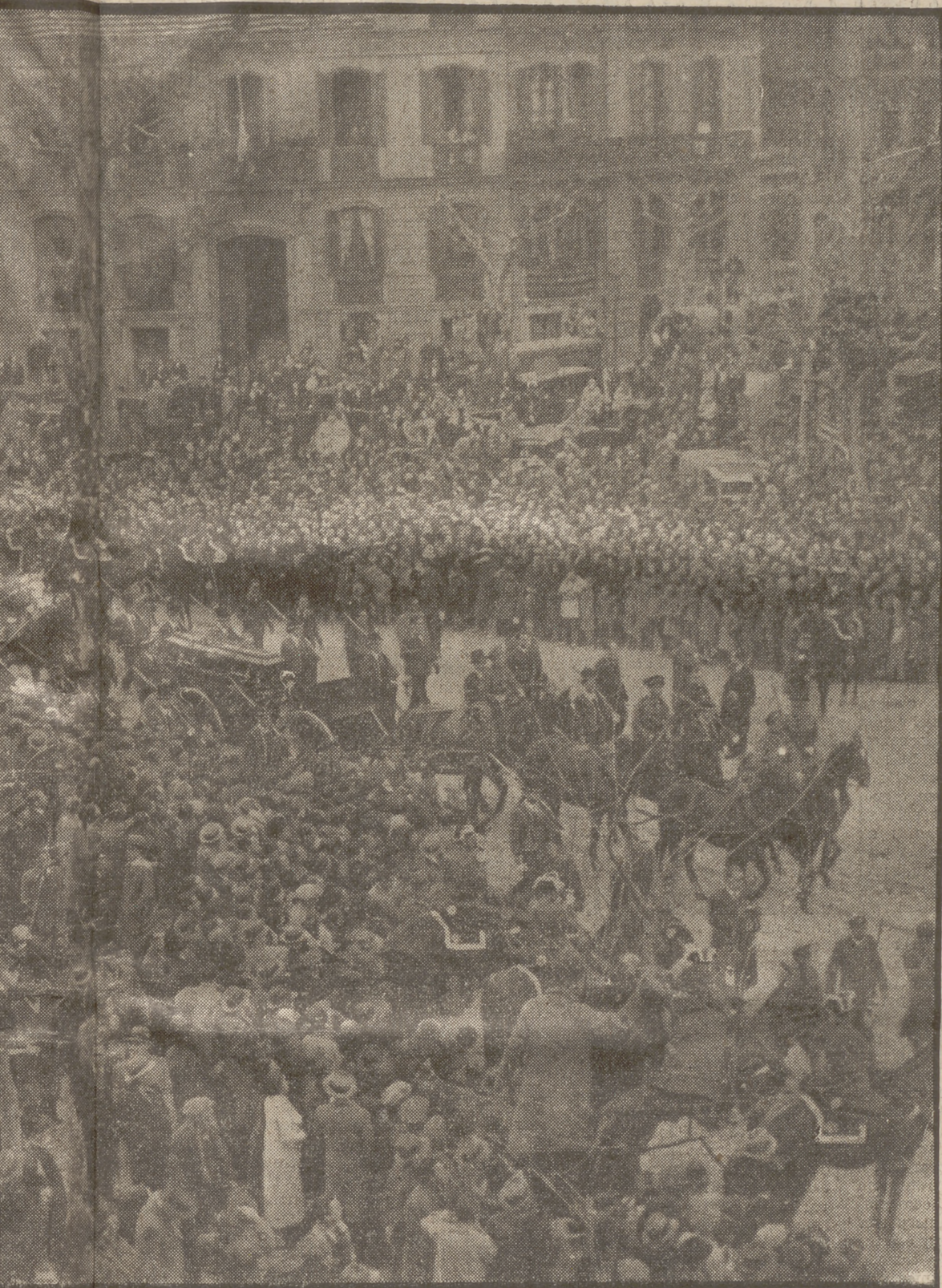
abast tan remarcable— ha palesat l'amor intens, l'adoració fervent que sentia per Francesc Macià, a oferir, pel seu triomf, el sacrifici dels seus béns i de la seva vida. El poble de Catalunya és agraït, i a la seva darrera estada les despulles glorioses del primer President de la Catalunya recobrada. Catalunya vingueren corruets de ciutadans, sense distinció d'estaments ni d'ideals polítics. Integrant enciant en religiós silenci la imponent desfílada, hi era tot un poble, que agraeix, que estima, que adora de Francesc Macià, el gran patriota, alliberador de Catalunya.

Gassol—, íta excepció de Guai, la Bèlgica d'Amèrica. El seu viatge a l'Argentina, fou també expulsat, li va conèixer el doctor Alfred Palacios, el qual va fer una ansa aferrissada de Macià. El 1928 Macià tornà a Bèlgica des d'on mantingué constant contacte amb els exiliats polítics espanyols que treballaven per l'enderrocament de la dictadura, i, amb ella, la monarquia. Fins que, el mes de març del 1930, Primo de Rivera, cap de l'últim dels autòcrates, substituït per Berenguer, tornaren a Catalunya la majoria dels exiliats polítics. Només va fer-se una excepció a l'hora de l'amnistia: Macià. El Govern Berenguer no podia perdonar-lo. Però, en aquells governants, i pensant bé, que a causa de Catalunya rebria un gran reforç el seu retorn i Francesc Macià arribà a ésser un dia, ho havia estat d'altres, l'exiliat per la causa de Catalunya. tornar a Bèlgica. —dar-