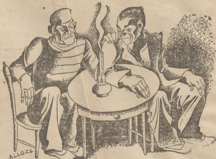
— Però, en pots viure, de fer aquesta feina? — Veuràs! Em paguen nonés que per anar tirant.

Mentre les esquerres que tenen el precedent d'una història brillantment revolucionària, que portaren el país d'abril i que en unes glòrieses Corts Constituints han fet una admirable