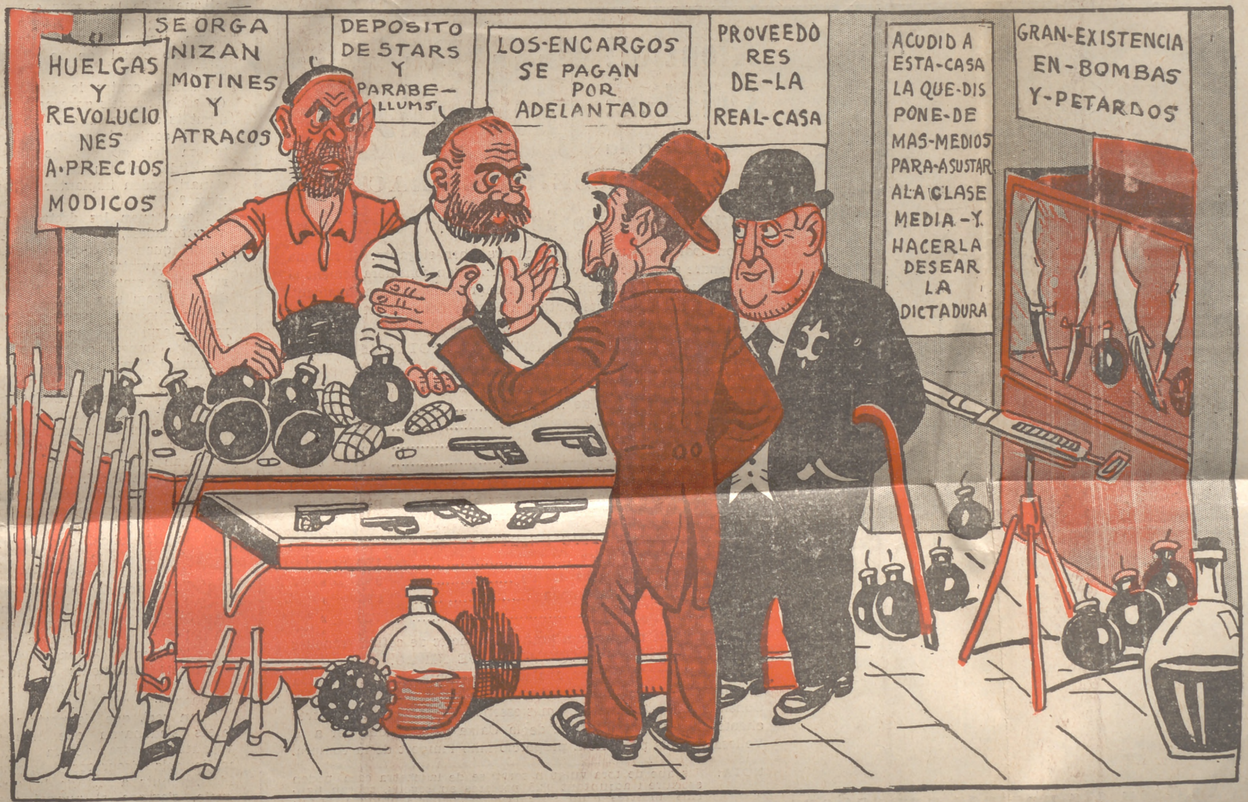
— Què és la dictadura, vau tancar la botiga, oi? — Naturalment. Com que no rebíem cap encàrrec!

—Bé, direu vosaltres. Es que després d'això no ha quedat implantat el «comunismo libertario». Aclarim-ho. Si no ho ha estat no és pas per culpa de la «comisión organizadora». La culpa és del poble, que no ha sabut comprendre els beneficis del sistema. Som un país endarrerit, ve't-ho aquí. Esperem que d'ací sis mesos, amb una empenya més i uns quants camions reduïts a cendres, el «comunismo libertario» serà un fet. I aleshores viurem felïços!!