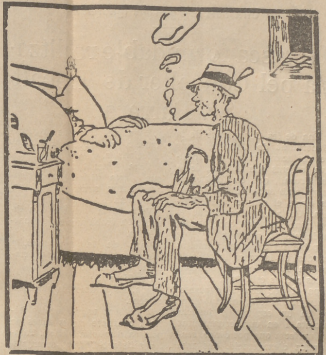
—Senyore que no estaré bo per poder anar a votar. —... però al vot la Lliga i t'hi portaran en camilla i fins et faran retratar perquè surtis als diaris...

No hi tenim res a dir. L'ésser pobre no és delicta.