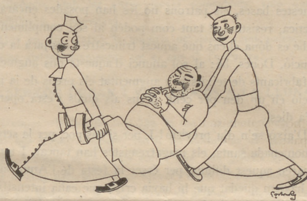
Santificaràs les festes

Davant nostre ha passat un xicot, el qual no hem reconegut en alçar-se de la cadira. L'ondulació, el massatge i tota l'enderga de friccions, pomades i "shampoo", l'han transformat per complert. Ha passat un nen, una d'aquestes inefables criatures que mai no estan quietes,