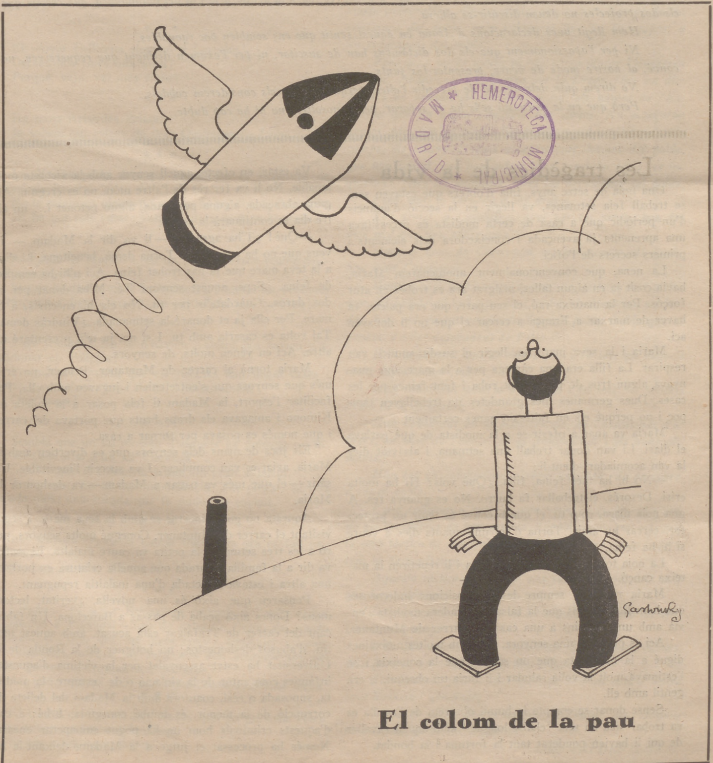
El colom de la pau