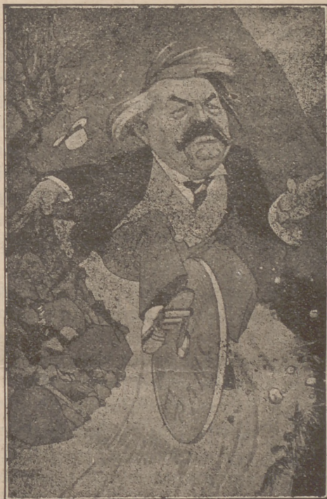
Aristides Briand és mort. Amb aquesta mort la política pacifista perd el seu més gran defensor

Pocs homes han tingut la tenacitat, la fermesa amb què a tot arreu Briand ha sostingut i defensat l'obra del pacifisme. El seu nom restarà inesborrable en la història com el més ferm paladí de la pau.