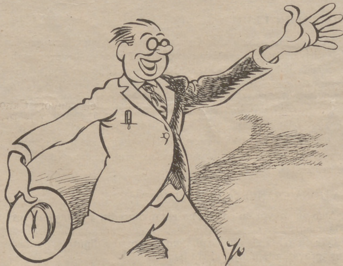
La impaciència d'un "radical"

El Sr. Lerroix és un home d'una serenitat política exemplar, no es deixa portar mai per les emocions, sap refrenar-se,