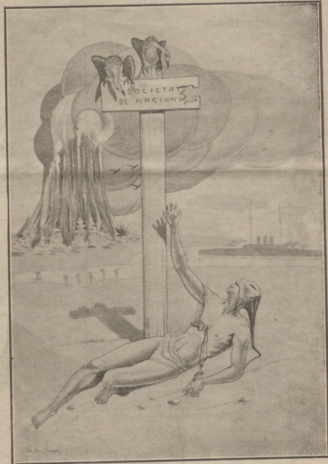
Les conferències del desarmament... i els resultats que produeixen.

—Gràcies a Déu, que ja s'acosta l'hora de manar!