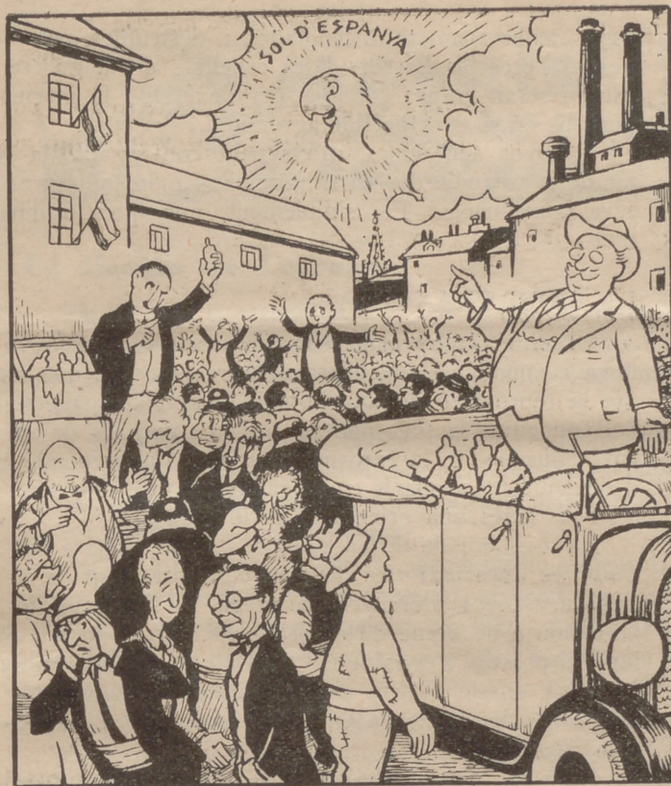
Aquests mítings, millor seria que els fessin...