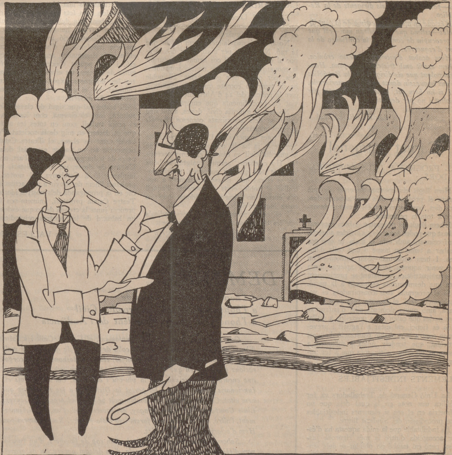
La política més necessària

gica, contra molts altres sacerdots indignes que pertorben l'ordre i fomenten el fanatisme i l'odi; que només vulgui veure el govern el perill de les extremes esquerres; que mentre hom deixa fugir els polítics,