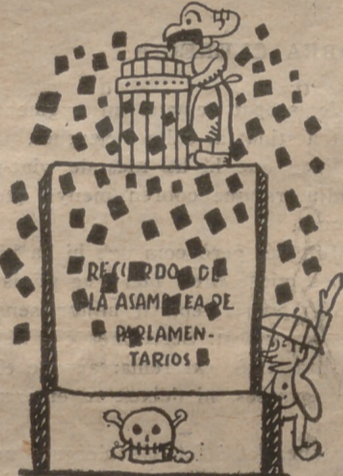
Y como el niño no es manco arrempuja cierto banco.