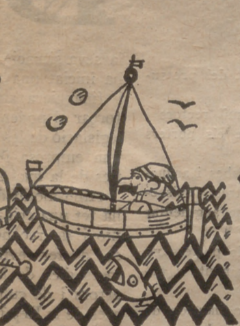
Y un ministro, ¡vive dios! que vale, lo menos, dos.