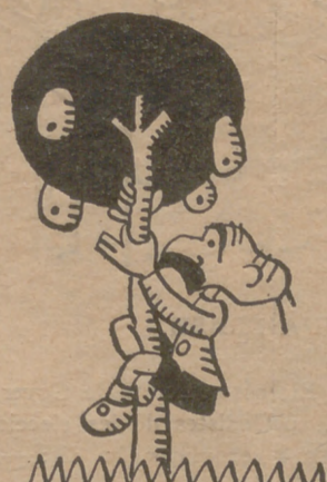
Ya crecido, demostró sus dotes de grimpadó.