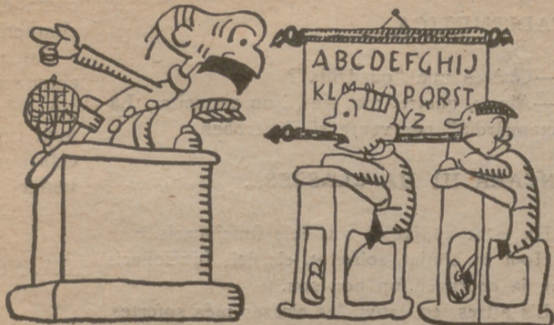
Celebra un día una asamblea, y encima de ella se m...