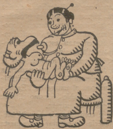
Recièn nacido este nano, ya demostró ser un mano.