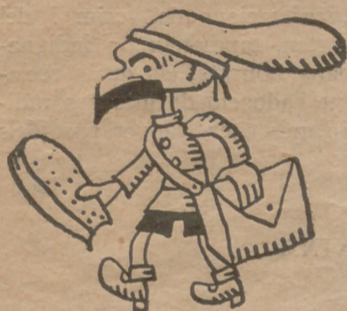
Estudió para abogado, oficio de hombre avisado