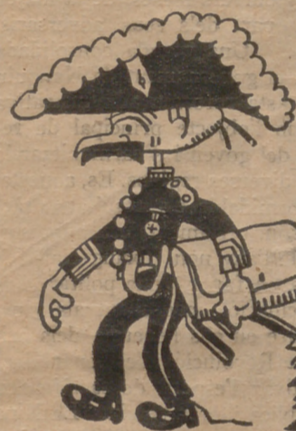
Por tan plausible razón es ministro de ocasión.