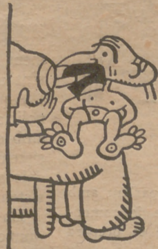
Xarrupava la m..... dejándola exhausta a...