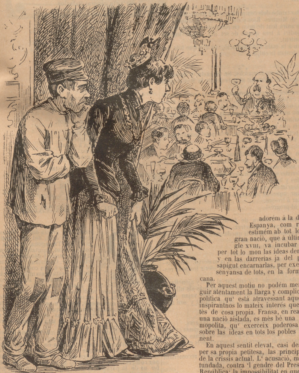
LOS QUE MENJAN Y 'LS QUE DEJUNAN.

PREU DE SUSCRIPCIÓ: Fora de Barcelona cada trimestre ESPANYA pessetas 1'50 Cuba y Puerto-Rico, 2.—Estranger, 2'50.