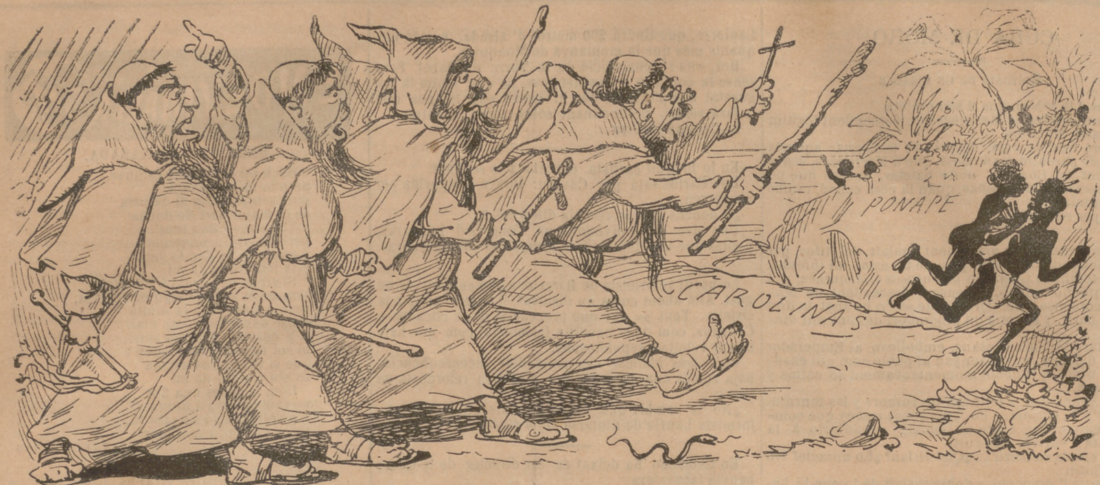
L' arreglo de Ponape: sistema fusionista.