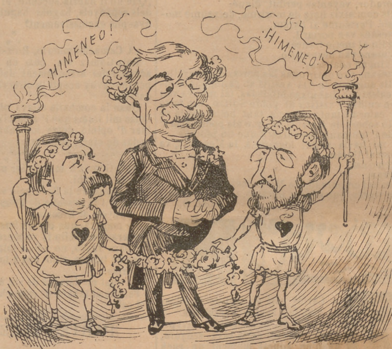
Himeneo!... Dia feliz!...