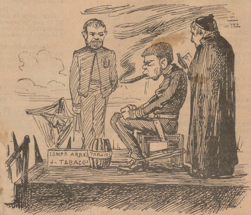
Modificaciò de la pena de mort.—«Al reo se li fan fumar un ó dos puros de l' Arrendataria de tabacos... y llestos!»