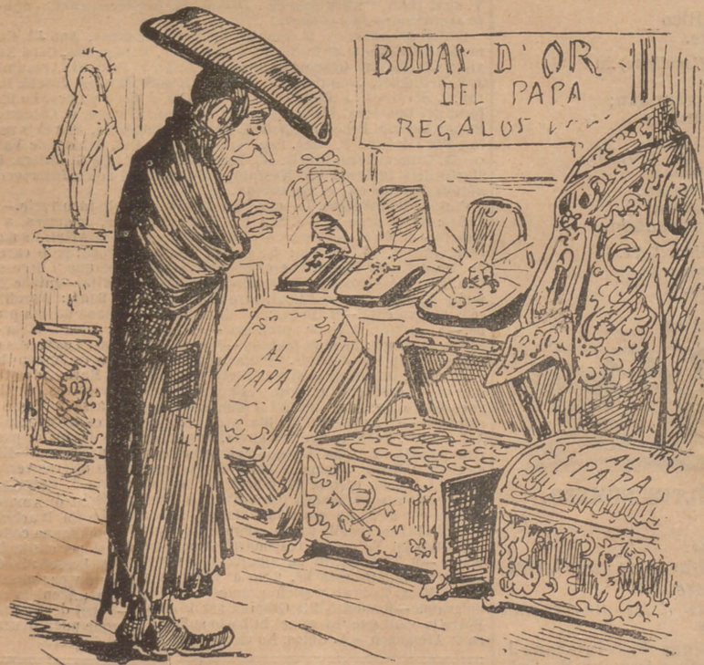
¡Si jo sabí que casantme, m' havian de fer tants regalos!...