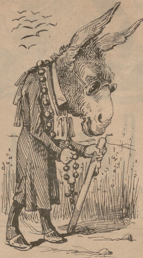
Burro va marxarhi, burro n' ha tornat; la butxaca vuyda y 'l clatell... poblát.

Mes las donas lo rebutxan y ni menos se 'l escuchan. Fins alguna de més brava li dona un xasco que 'l clava. Comprenent ell la indirecta, fuig cap á Chile tot recte.