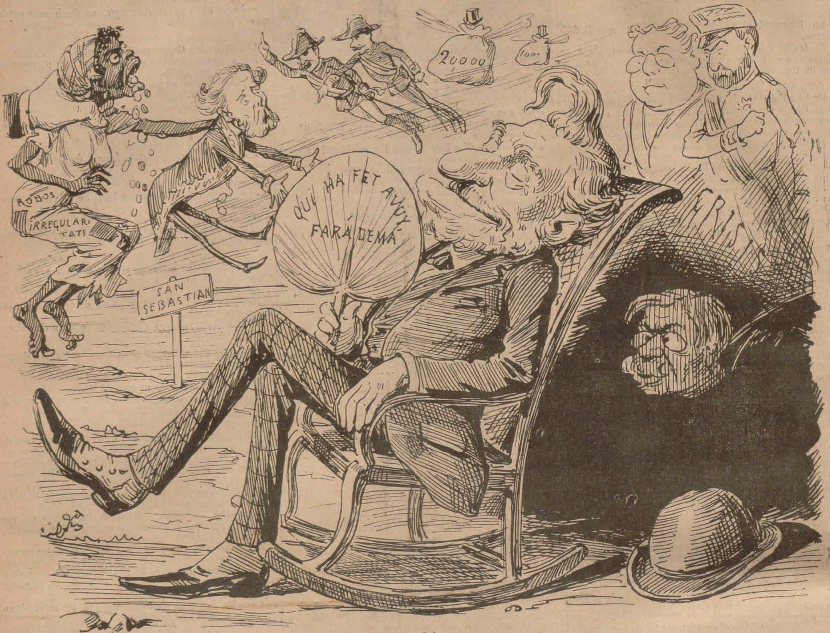
No mirar res del que passa, gronxarse, anar de tiberi: aquí tenen la gran feyna del jefe del ministeri.

«Hem assistit a la Marxa de las Antorxas, que produhia un gran efecte. Hem presenciat alguns miracles.»