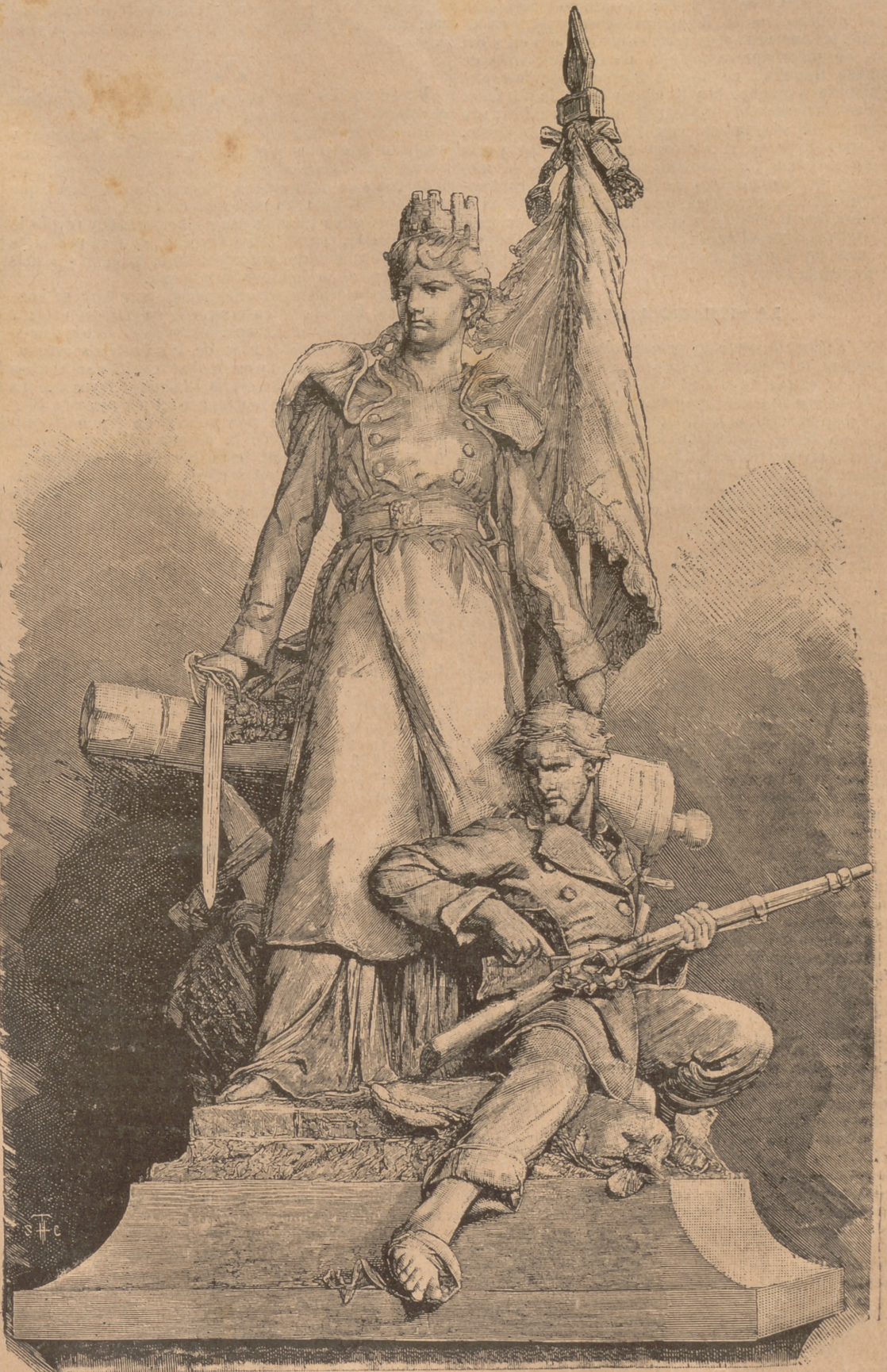
LA DEFENSA DE PARÍS.—Monument erigit en Courbevoie (Aforas de París).

Anys endarrera, publicá LA CAMPANA DE GRACIA l' acta de naixement de la República, reproduhint ab fidelitat los incidents més culminants de la memorable sessió de l' Assamblea nacional en que fou proclamada. Naixement més honrat ningú pot disputarli. Fou filla no de la violencia, sinó del dret y de la convicció dels representants del país y vingué á satisfer la necessitat de un govern regular y legítim que aquest sentia, desde 'l moment que quedava vacant lo trono revolucionari, no certament per l' hostilitat dels republicans,