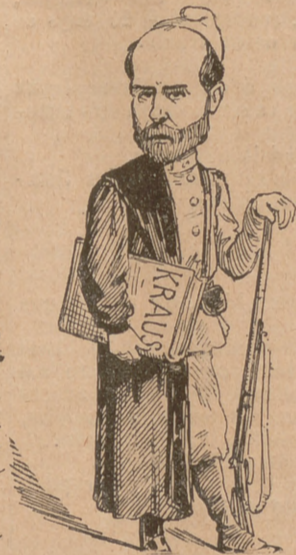
Mitj per la ley, mitj per la forsa; total, res.