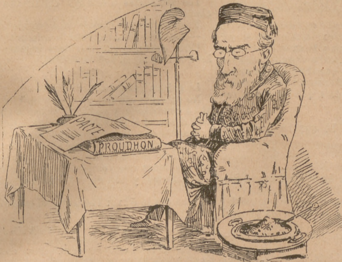
¡Pacte... y á casa!