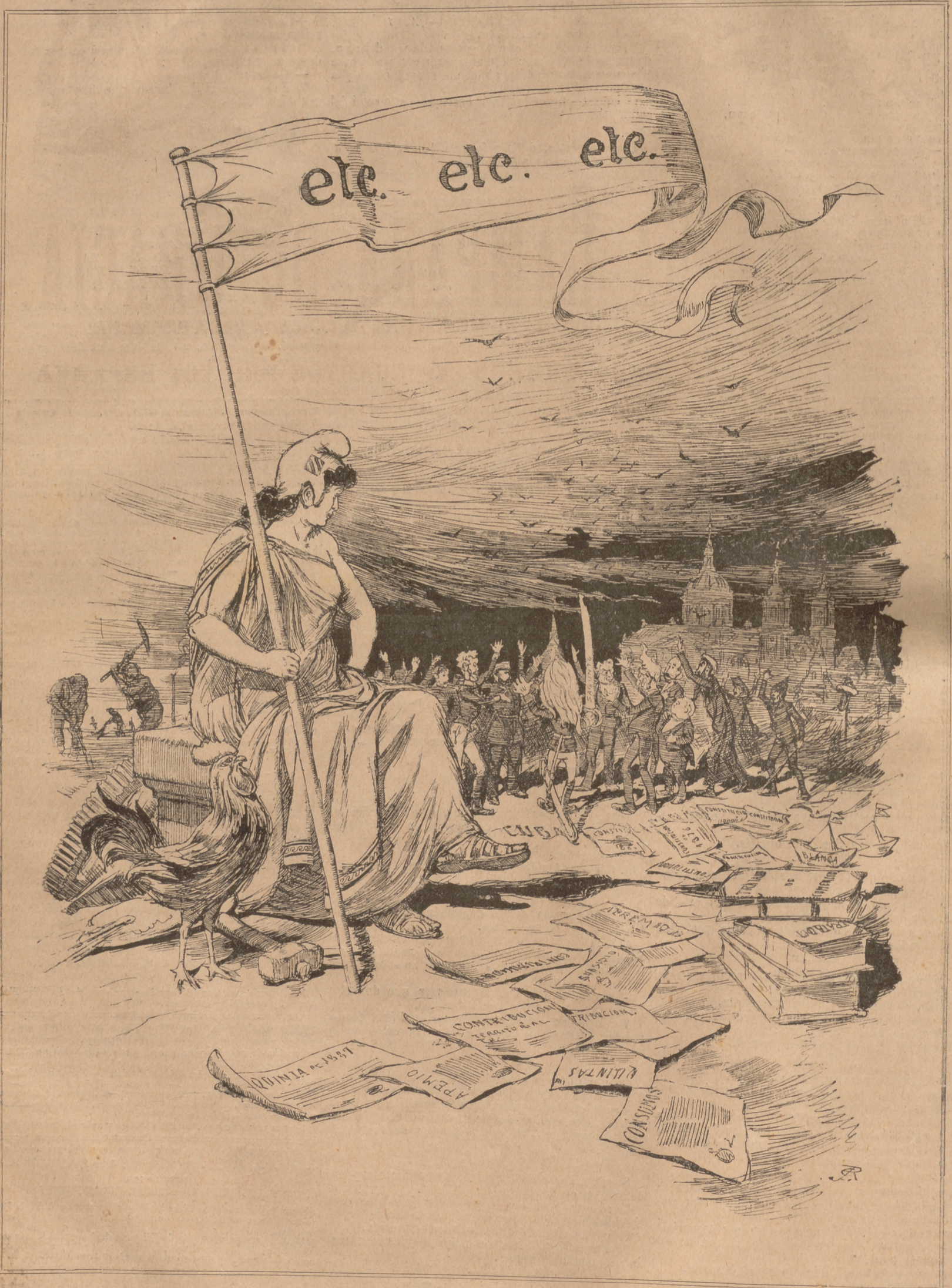
Tal dia farà anys.

STATU QUO. (Dibuix de J. Lluís Pellicer).