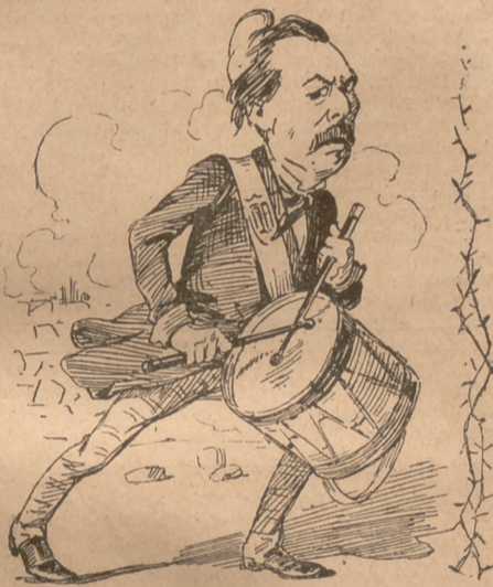
A só de tabals no s' agafan llebras.