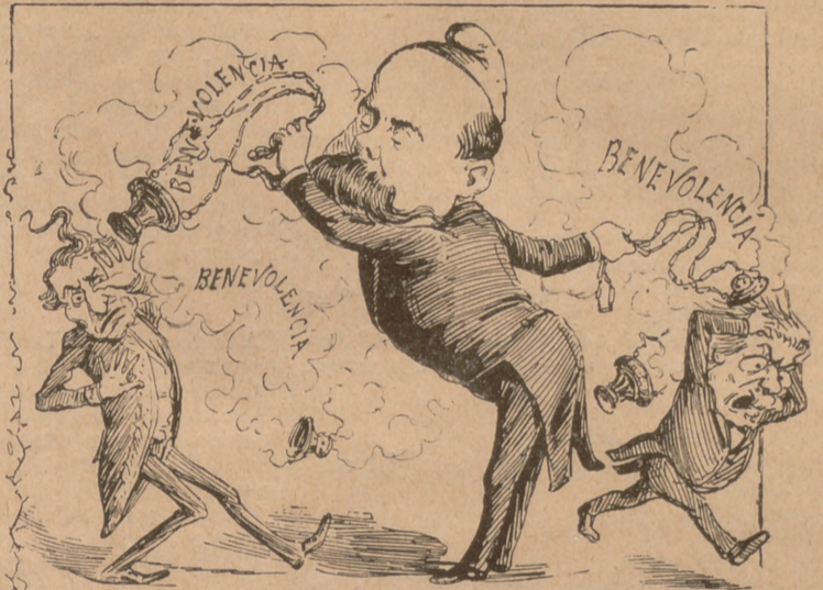
Visquém y vejém.