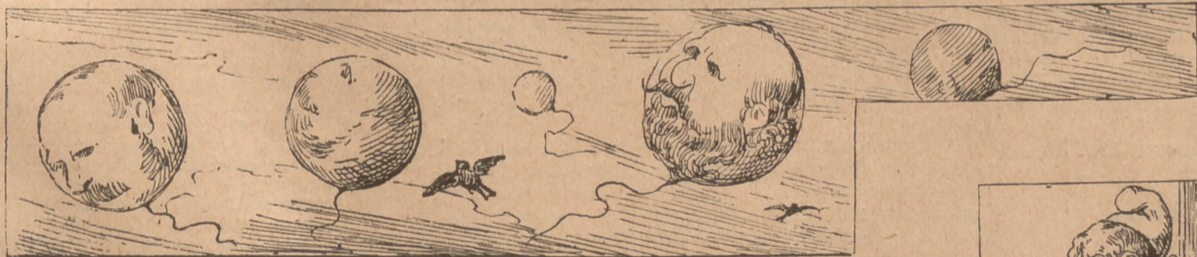
Los sueltos, perdentse pèls núvols.