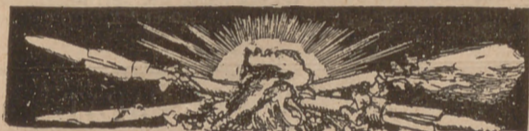
LO SANT CRISTO GROS.

PREU DE SUSCRIPCIÓ: Fora de Barcelona cada trimestre ESPANYA 8 rals Cuba . y Puerto-Rico 16 rals, Estranger , 18 rals.