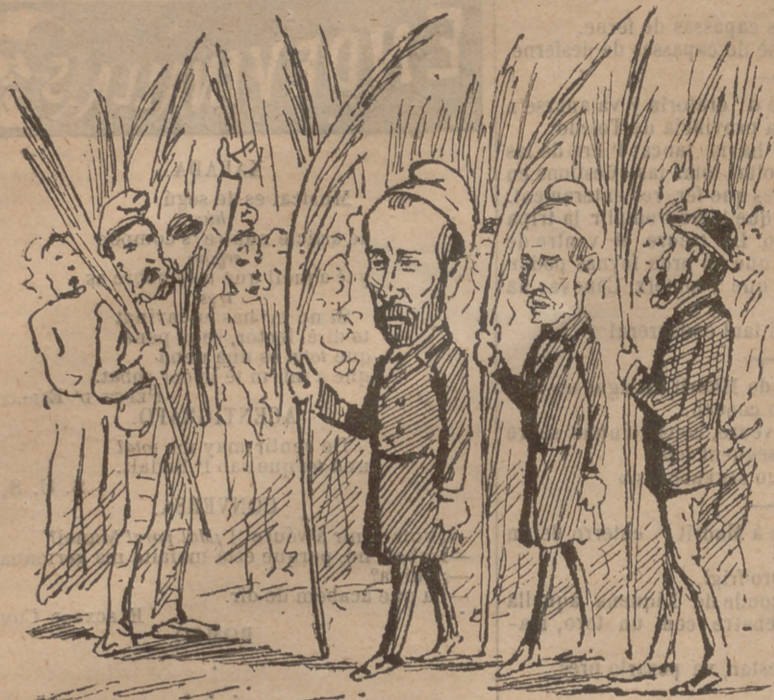
Los republicans barcelonins han celebrat aquest any una gran festa de rams. ¡Juli, juli! ¡Que volém entrar!