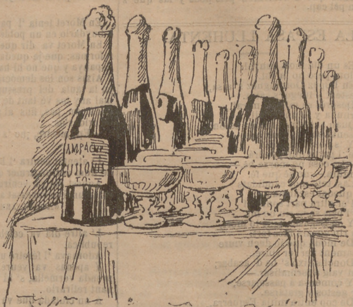
En cambi 'ls monárquichs madrilenyos, tant si es Quaresma com Setmana santa, teuen tot l' any guarnit lo monument.