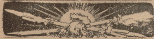
UN RAIG DE LLUM.

PREU DE SUSCRIPCIÓ: Fora de Barcelona cada trimestre ESPANYA 8 rals Cuba y Puerto-Rico 16 rals, Estranger, 18 rals.