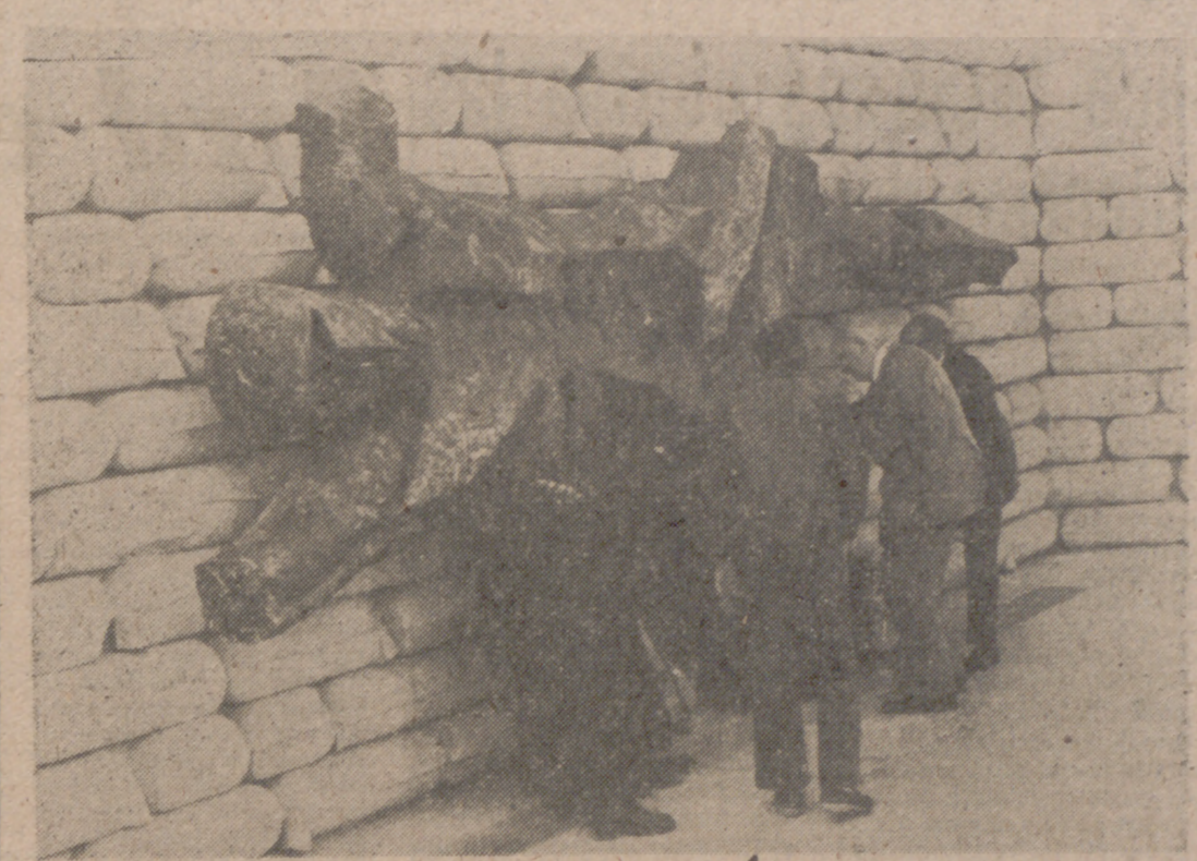
MADRID.—Ante el monumento a los caídos del Cuartel de la Montaña, que resultó dañado a causa de la explosión de un artefacto, se ha celebrado un acto de desagravio con la ofrenda de coronas de laurel por la Jefatura Provincial del Movimiento, Hermandad del Alzamiento Nacional, Ayuntamiento de Madrid, Vieja Guardia y Excavitos de Madrid. Presidieron el Subjefe Provincial del Movimiento, el primer Teniente de Alcalde, el Presidente de la Hermandad del Alzamiento Nacional, el Delegado Provincial de Excavitos y otras personalidades.