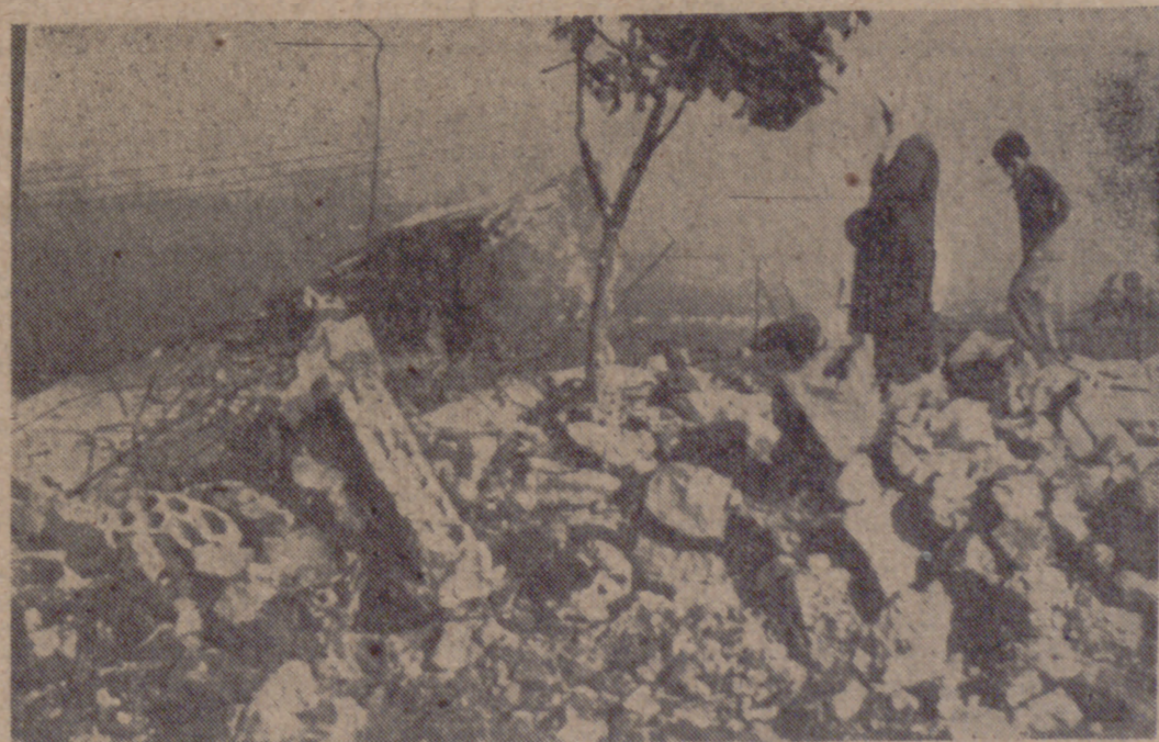
MAJDAL ZOON (Líbano).—Una mujer y un chico contemplan las ruinas de lo que fue una casa destruida durante el ataque de un comando israelí a esta zona del sur de Líbano.