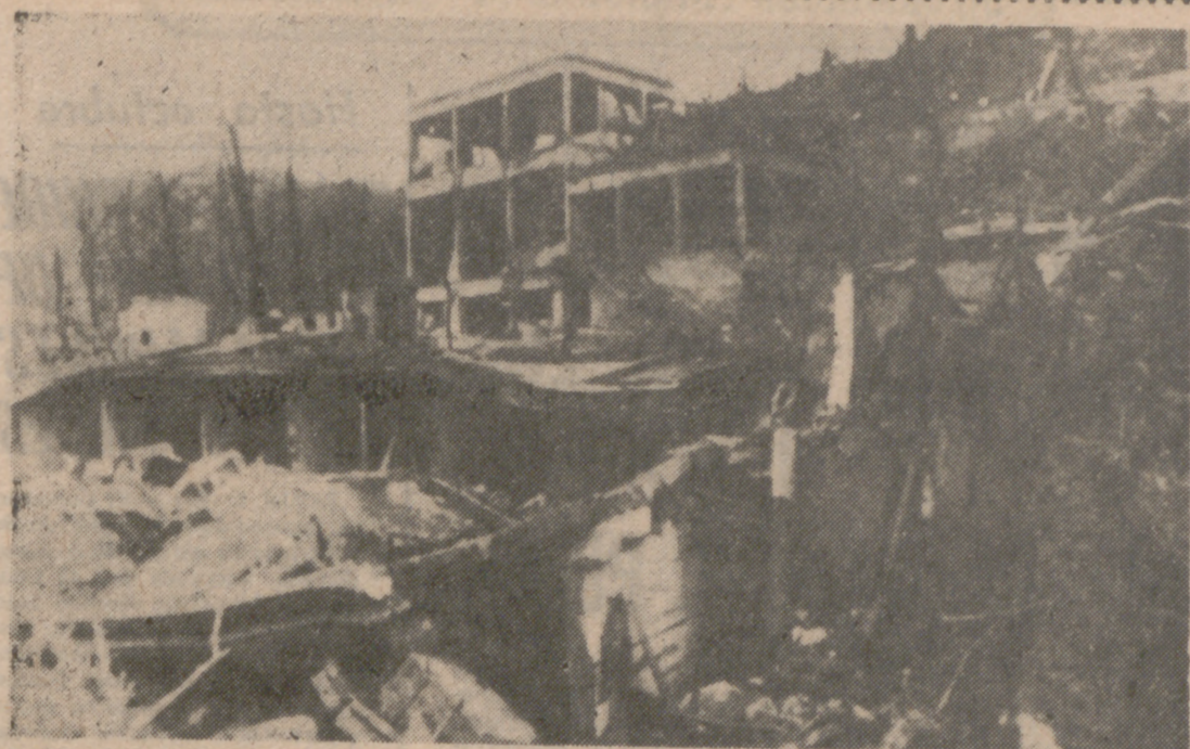
GALDACANO (Vizcaya).—En la foto, un aspecto del pabellón de la Unión Explosivos Rio Tinto donde se produjo la catástrofe.

— La nave "Soyuz 14" se acopló a un laboratorio en órbita