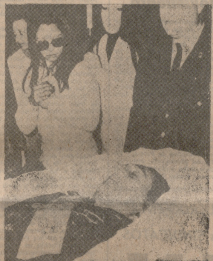
BUENOS AIRES.—Millares de personas de todas las clases sociales han desfilado ante el féretro descubierto, con el cadáver del Presidente Peron, expuesto en el Congreso.