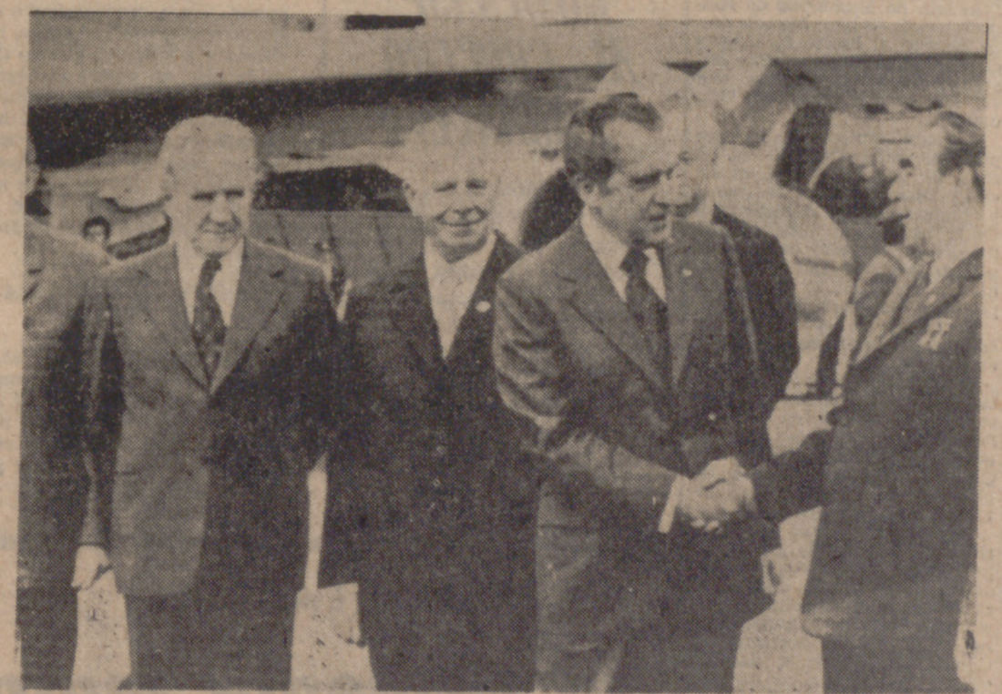
MOSCU.—Nixon y Breznev se despiden, finalizada la visita oficial del Presidente norteamericano a la URSS. En la fotografía, de izquierda a derecha, Gromyko, Kosygin y Podgorny.