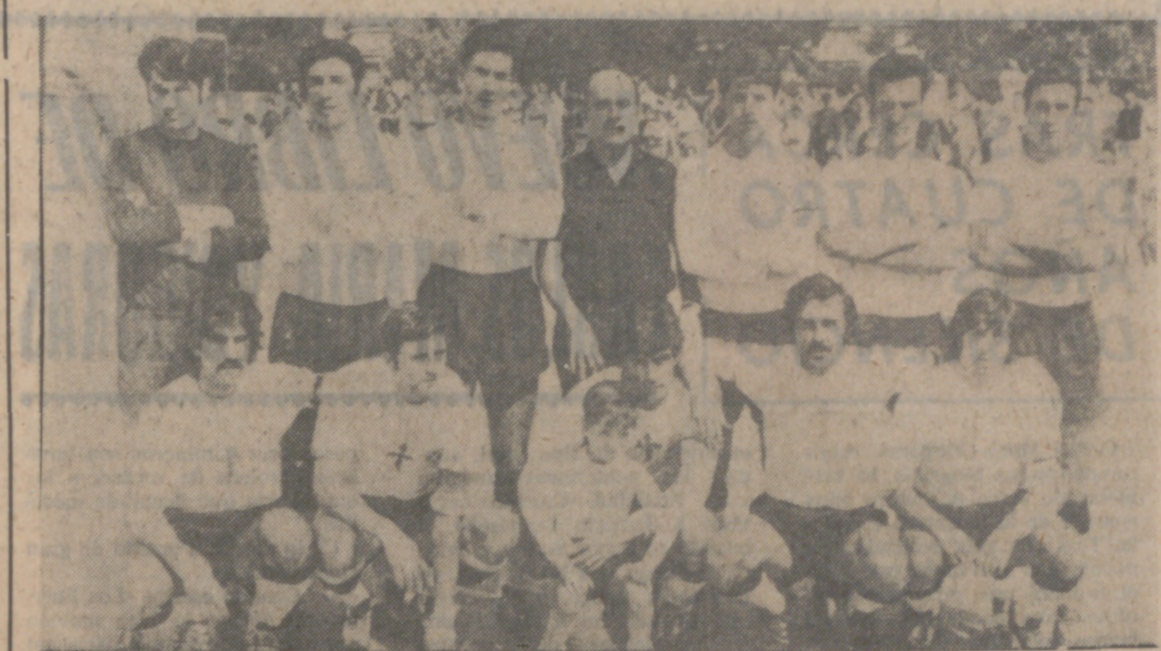
He aquí una reciente formación del Carabanchel. Este es el equipo que luchará con el Real Valladolid Promesas por un puesto en Tercera División.

El equipo madrileño, que ha sufrido recientemente una crisis directiva, ha sido acogido con moderado optimismo por los blanquivioletas