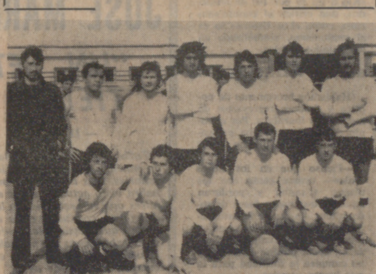
El San Carlos Atlético, que encontró el camino del gol ante el C. Telefónica.