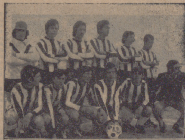
El San Fernando, goleado estrepitosamente.

Se jugaron los partidos correspondientes a la quinta jornada de la Copa Presidente de la Federación, dentro de la Primera Categoría Juvenil, y si en el segundo grupo Asklepios y Endasa están prácticamente clasificados, en el grupo primero tan sólo el Cristo Rey A es seguro clasificado. En el grupo primero, el Cristo Rey A derrotó por tres a uno al Racing Valladolid, que acusó en exceso la falta de su central Solete II. El encuentro fue muy disputado y el Cristo Rey dominó más, aunque contase con la fortuna a la hora de tirar a puerta. El primer tiempo terminó con el resultado de uno a cero a favor del Cristo Rey, gol