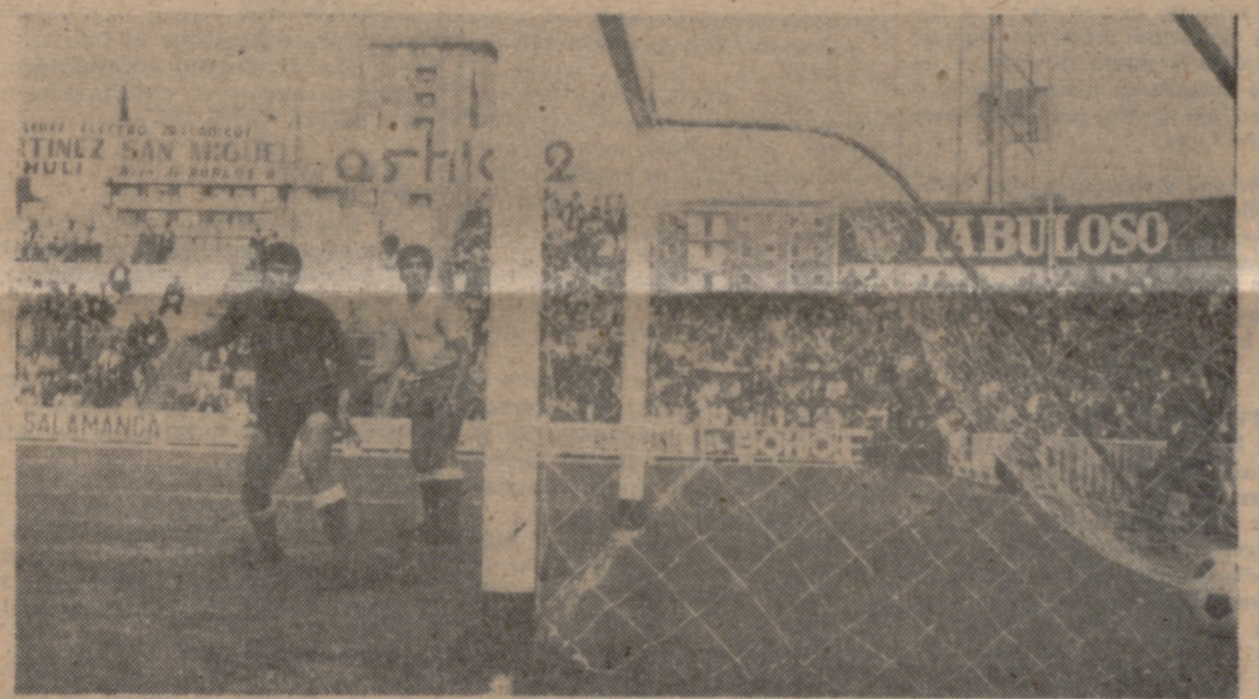
PRIMER GOL. — Luna y Puig miran con desconsuelo la trayectoria de la pelota, impulsada por Astrain, y que se acababa de convertir en el primer gol de la tarde.