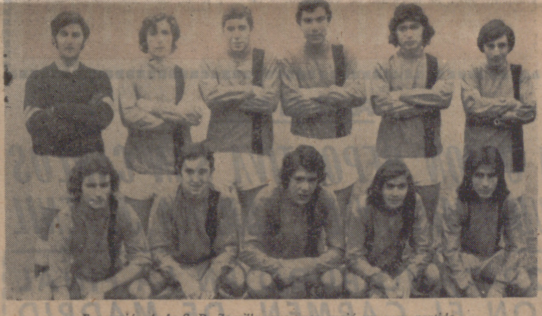
Formación de la S. D. Zorrilla, que ayer cuajó un gran partido.

Se jugaron los partidos correspondientes a la quinta jornada de la Copa Presidente de la Federación, dentro de la Primera Categoría Juvenil, y si en el segundo grupo Asklepios y Endasa están prácticamente clasificados, en el grupo primero tan sólo el Cristo Rey A es seguro clasificado. En el grupo primero, el Cristo Rey A derrotó por tres a uno al Racing Valladolid, que acusó en exceso la falta de su central Solete II. El encuentro fue muy disputado y el Cristo Rey dominó más, aunque contase con la fortuna a la hora de tirar a puerta. El primer tiempo terminó con el resultado de uno a cero a favor del Cristo Rey, gol