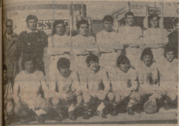
El Real Valladolid, que resolvió claramente su compromiso.