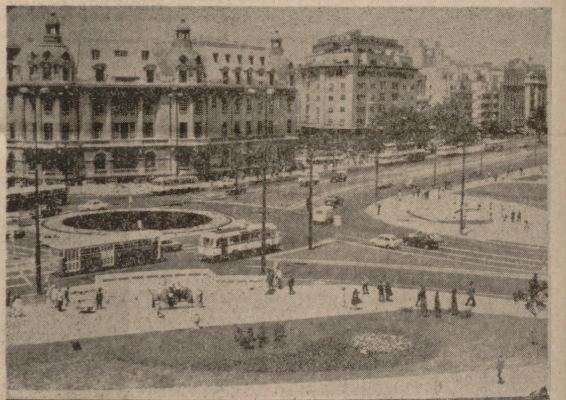
Universidad de Bucarest.