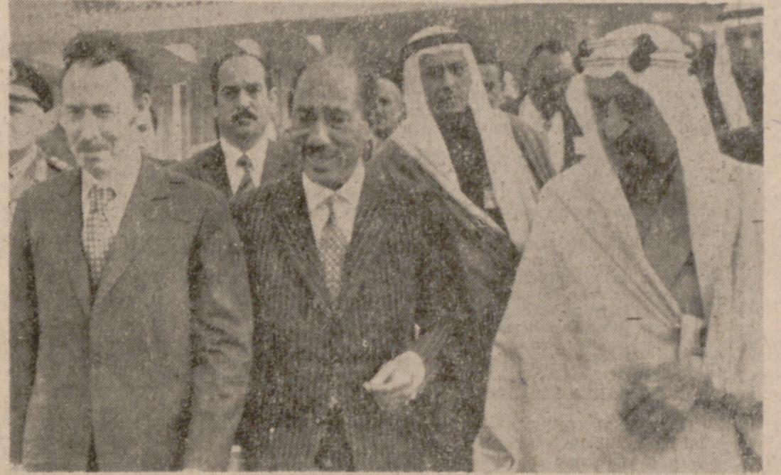
ARGEL.—Los presidentes de Argelia, Bumedian, y de Egipto, Anwar Sadat, con el Rey Faisal de Arabia Saudita, salen del Club de los Pinos poco antes de iniciarse la «cumbre».

ARGEL, 27. (Efe-Upi).—Algunos de los dirigentes del mundo árabe, que se reunieron ayer en Argel para trazar una nueva estrategia, después de la guerra de octubre con Israel, han pedido que se realicen preparativos para otra vuelta a las hostilidades. Uno ha manifestado: «Debemos realizar auténticos preparativos para la próxima guerra, que será decisiva.» Mahmud Riad, secretario general de la Liga Árabe, ha hecho un llamamiento para una «total movilización» militar, económica y política. (Pasa a la siguiente)