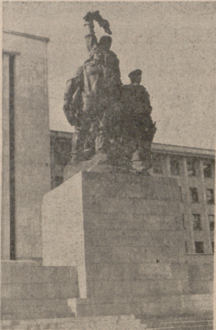
El monumento a los héroes ante el majestuoso edificio de la Academia Militar General, sede de las tres armas.