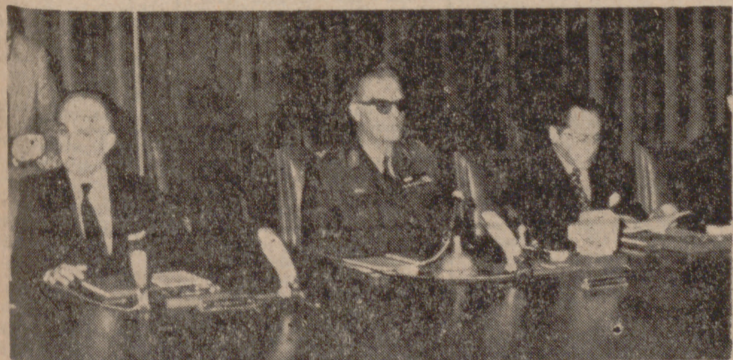
ATENAS.—Primera reunión del nuevo Gobierno, presidida por el general Gitzikis. A la izquierda, el nuevo premier.