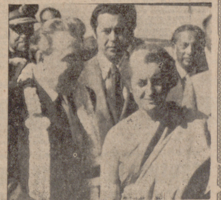
NUOVA DELHI.—El secretario general del Partido Comunista soviético, Leonidas Breznev, aparece a la izquierda, junto a la jefe del Gobierno indio, Indira Gandhi, en el aeropuerto de Nueva Delhi, al que acababa de llegar.