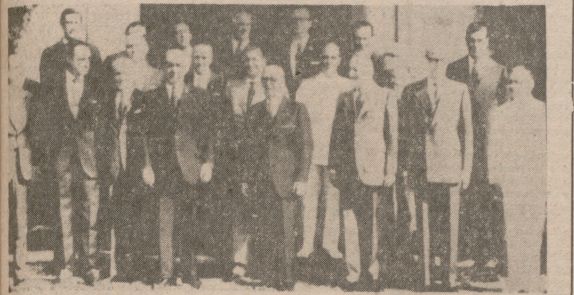
LA CORUÑA.—Bajo la presidencia del Jefe del Estado, se reunió ayer en el Pazo de Meirás el Consejo de Ministros. Los componentes del Gobierno, fotografiados con el Caudillo a la puerta del Pazo, momentos antes de iniciar la reunión.