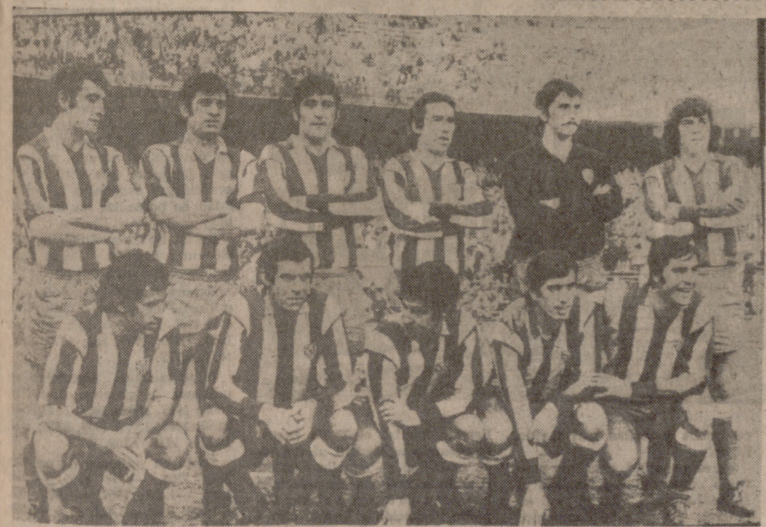
ATLETICO DE MADRID

HUELVA. (PYRESA). — Benfica de Lisboa, Derby County, Dynamo de Tbilisi y Atlético de Madrid disputarán a partir de hoy la valiosa carabela con que los organizadores del IX Trofeo Colombino premiarán al equipo vencedor de esta novena edición. El primer encuentro de la primera jornada se disputará el sábado en la ciudad de Lisboa y el Derby County. A las once de la noche se jugará el segundo encuentro, entre el Atlético de Madrid y el Dynamo de Tbilisi. Los vencidos en ambos partidos disputarán mañana la final de consolación, para inmediatamente pasarse a la disputa de la gran final entre los ganadores. Historial del Trofeo I (año 1965). — Campeón, Recreativo Huelva; subcampeón, Gónova. II (año 1966). — Campeón, Atlético de Madrid; subcampeón, Recreativo de Huelva. III (1967). — Campeón, Huelva; subcampeón, Sevilla. IV (1968). — Campeón, Betis; subcampeón, Huelva. V (1969). — Campeón, Sao Paulo; subcampeón, Real Madrid. VI (1970). — Campeón, Real Madrid; subcampeón, Spartak. VII (1971). — Campeón, Újpest; subcampeón, T. S. K. A. VIII (1972). — Campeón, Atlético de Madrid; subcampeón, Slovan. TAMBIEN SE INICIA EL «PRINCIPE DE ESPAÑA» SANTANDER. (PYRESA). — Hoy comienza en esta ciudad la tercera edición del Trofeo «Príncipe de España» de fútbol, en el que tomará parte los equipos del Sporting