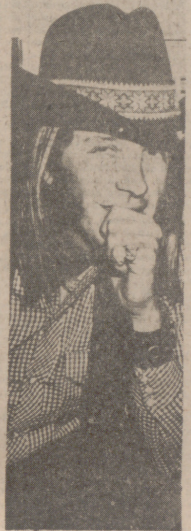
Doug Sahn, nuevo valor de la música USA.