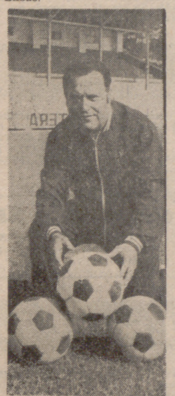
—Un momento difícil...

—Ha habido momentos muy buenos. Los mejores, tal vez, ganar al Santander la promoción de ascenso y jugar la final de Copa contra el Athletic de Bilbao.