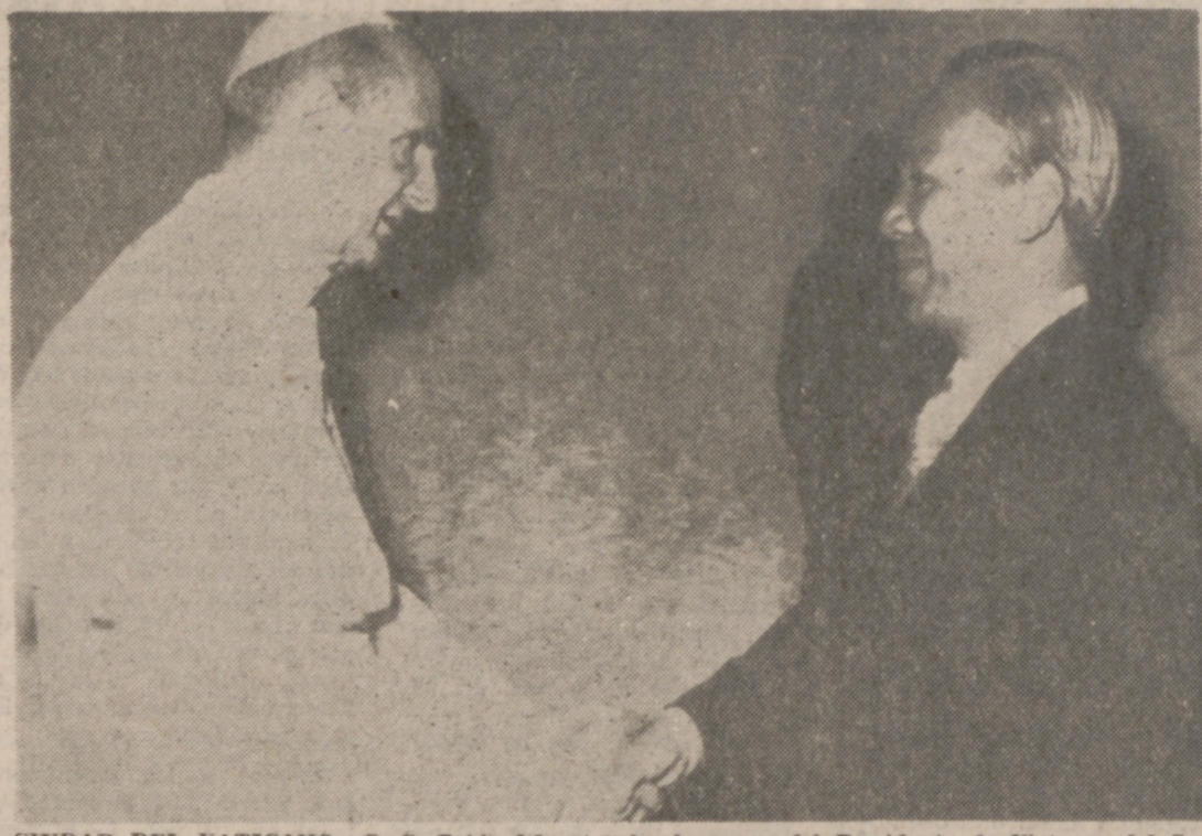
CIUDAD DEL VATICANO.—S. S. Pablo VI estrecha la mano del Presidente de Vietnam del Sur, Nguyen Van Thieu, durante la audiencia que le concedió ayer en el Vaticano. (CRONICA DE ROMA, EN SEGUNDA PAGINA)