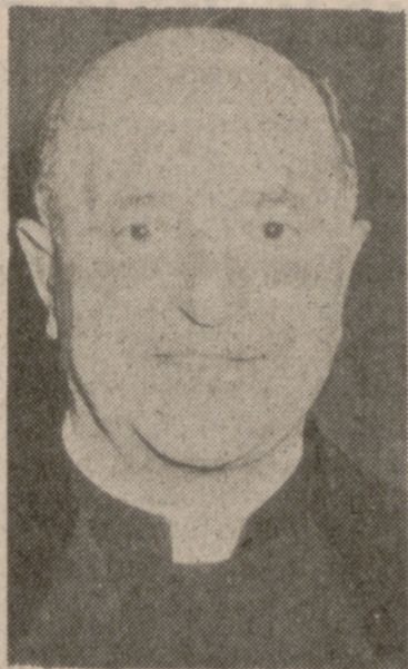
para comprometerle en la justicia, el amor, la paz, la sociología.

El mensaje mariano de hoy es el Caná: «Haced lo que El os diga». El Evangelio como pista segura; no es maqueta de la unidad terrestre, va más allá, va directamente a la conciencia del hombre