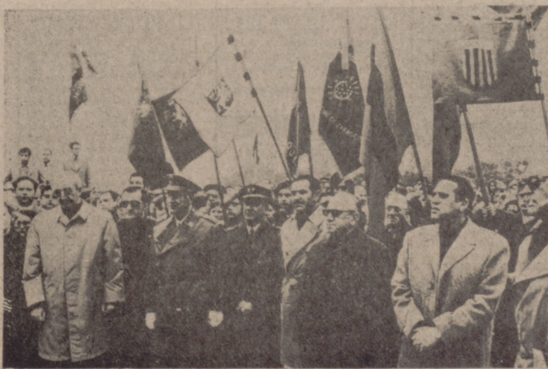
ALCUBIERRE (Zaragoza).—Un aspecto de la gran concentración de Alcubierre, sobre la que ayer ofrecimos amplia información, y que presidió el Vicesecretario General del Movimiento.